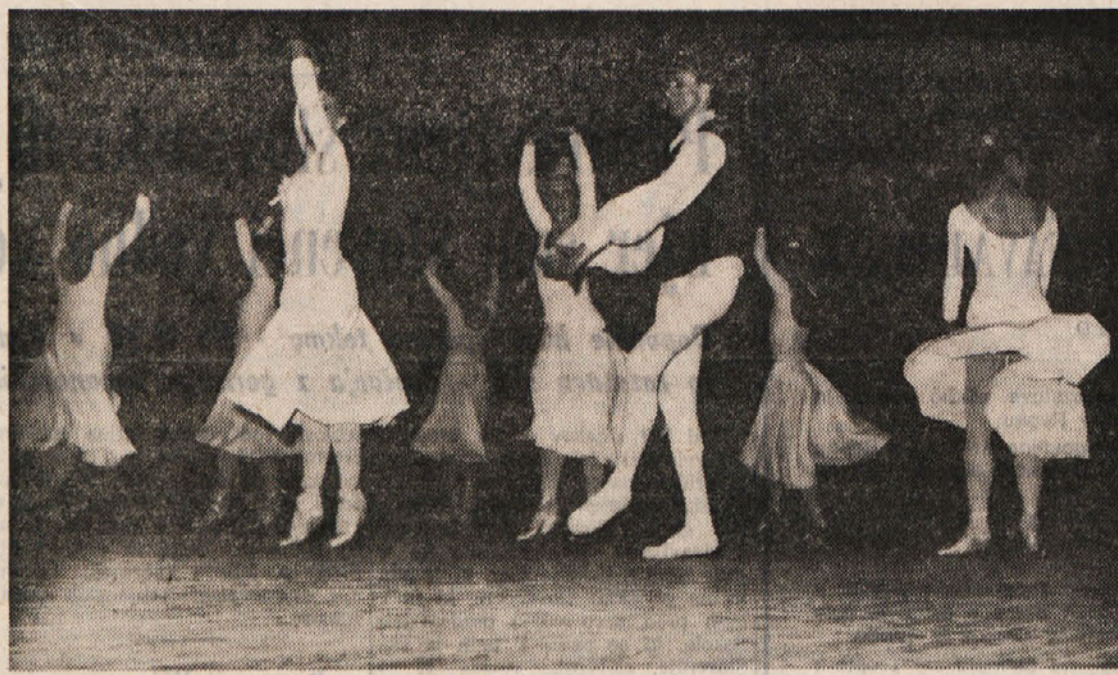
Prejšnji ponedeljek je bilo v gledališču "F. Prešeren v Boljuncu srečanje z Baletom gledališča Verdi...