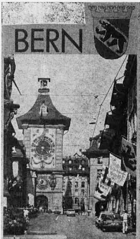
Zeitglockenturm - Stolp z uro na zvonove, simbol Berna, vstop v ulico Kramgasse, od leta 1250 glavni vhod v mesto. Posebnost ure je, da se štiri minute pred bitjem prikažejo od leta 1527 razne postave, ki nekako naznanjajo uro

Zadnji dan je šlo vse bliskovito. Najprej do Zenevskega jezera proti Martignyju, kjer se spet francosko govori, nato skoz predor Velikega sv. Bernarda (ki ga je že