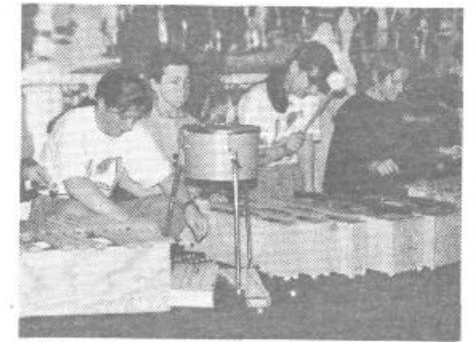
Kako prelesta je dolenska pokrajina na robu Ljubljane, je bilo moč videti na s prelepimi fotografijami opremljenimi panoji Velikih Lašč in okolice, predstavljen je bil nov projekt vodnik s kartografskim prikazom, povabilo v ta svet pa so nam pričarali velikolaški solarji s koncertom na starih domačih glasbilih.

Ze na sam dan otvoritve so se vrstili pomembni obiski in ogledi. Poleg predstavnikov naše občine pa so vsem prijetno dobrodošlico pripravili Gostilna Pri Rožici iz Preserj in dijaki slaščičarskega oddelka Srednje agroživilske šole.