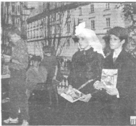
O tem, kakšno je bilo nekoč in kakšno je danes znano ljubljansko predmestje Trnovo, so obiskovalcem povedali kar trnovski solarji sami, ki so na to temo pred dvema letoma pripravili posebno nalogo in jo obelodanili v prijetni knjižici.