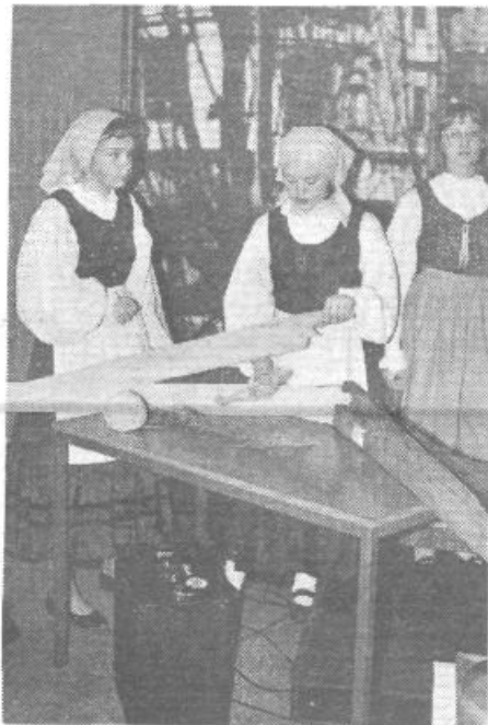
Kako se tere lan, kako se je to počelo nekdanj, kakšni običaji, pesni in pesmi so spremljali to kmečko opravilo nekdanj, pa so z veliko vedrine in prisrčnosti predstavili mladi pevci in folkloristi horjulske osnovne šole in svoj nastop so morali ponavljati.