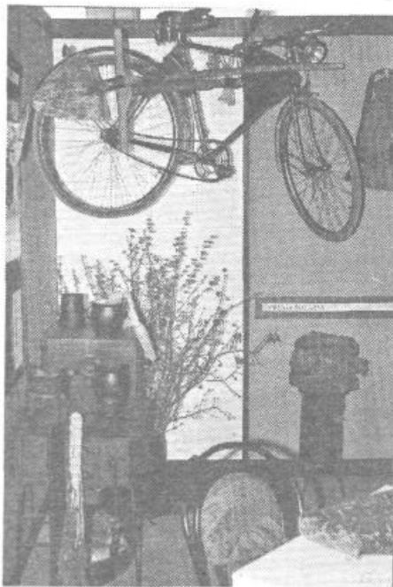
Veliko pozornosti in zanimanja pa je vzbudila prava razstava starih barjanskih posebnosti, kot so stara oprema šotarja, štedilnika, ki so ga predniki kurili s šoto, kar so zbrali učenci OŠ Oskar Kovačič in kot staro etnološko zapuščino predstavili obiskovalcem skupaj s prikazom rimskih izkopanin.