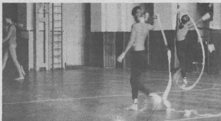
Vadba s kiji in trakovi je sicer zahtevna, vendar jo mlade tekmovalke dobro obvladajo