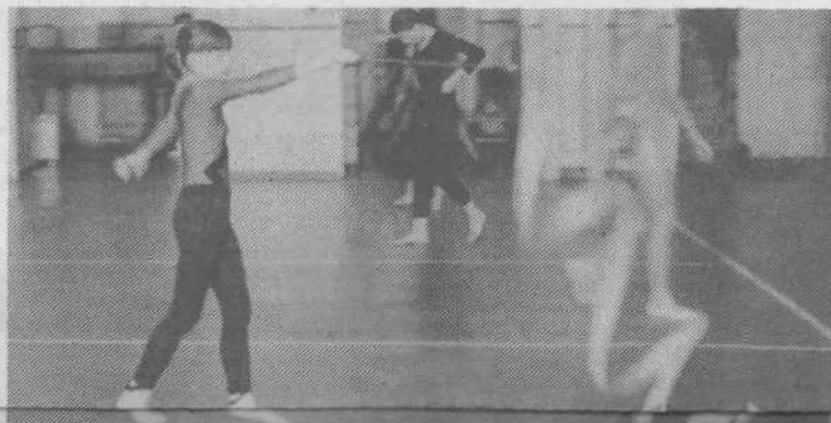
Ritmična gimnastika zahteva veliko mero elegancije in posluha, kar ne dela preveč preglavic mladi tekmovalki na sliki