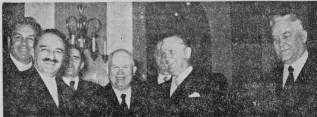
Sovjetska delegacija na obisku v Zveznem izvršnem svetu. Od leve na desno: g. Sepilov, Mikojan, Gromiko, Hruščev, K umikin, preds. Tito in Bulganin

nem pa postavlja na prvo mesto načela miroljubnega sožitja, in katerih temelje tudi beograjski pomniki.