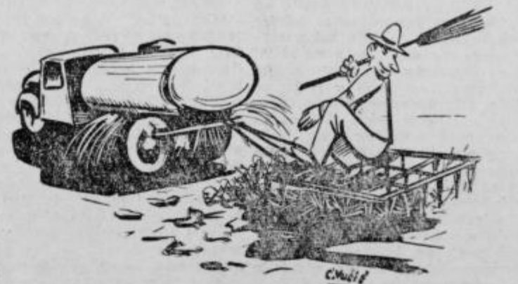
»Če že zaradi dežja ni treba škropiti ptujskih ulic, jih tako vsaj lahko pometamo!«

Vabimo vse člane, da se občnega zbora v čim večjem številu udeležijo.