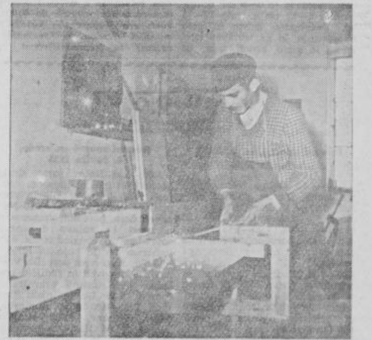
Obiščite v Sred. ekonomski šoli v Ljubljani od 5. do 12. junija 1955 razstavo izdelkov vaših mladine

Dohod na prireditveni prostor restavratorskega vrta na gradu bo s severne strani iz Rajčeve ulice. Shramba koles kakor ob sejmih na Kvedrovem trgu in v Dravski ulici. Shramba vozov na sejmšču. Parkiranje avtomobilov, traktorjev, avtobusov in kamionov na Titovem in Kvedrovem trgu. — Po večernih predstavah prosta zabava s plesom na vrtu grajske restavracije — Za jedila in pijačo vsestransko poskrbljeno! — Opozorjamo še enkrat vse abonente na premerno in prvo reprizo, da bo za njih predstava v soboto, 4. junija, ob 20. uri!