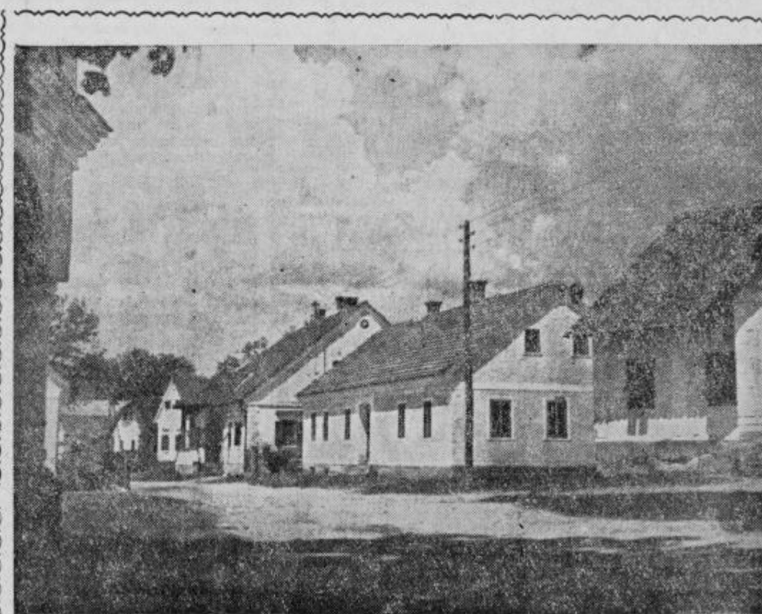
Udeležite se v čim večjem številu

Po zakonu o razlastitvi posestev, ki jih obdelujejo kolonji in viničarji, je bilo razlaščenih 230,77 ha zemlje od 32 nekmetov, ki so potom viničarjev obdelovali vinograde. V tem primeru gre predvsem za gostilničarje, manjše trgovce, odvjetnike in druge nekmete. Po tem