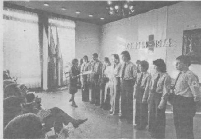
Tudi zmagovalna ekipa v prvi pomoči z osnovne šole Jožeta Moškriča je prejela zasluženo priznanje

Medvode 121, Toplarna Polje, Kekčeva 26 ZTP Moste Ul. M. Majcna 13, Izolirka