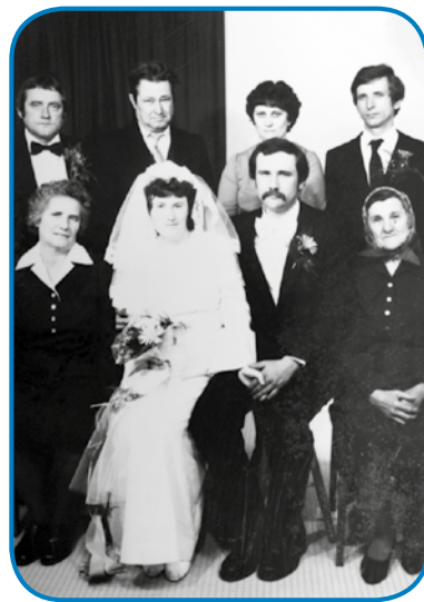
Zdavanjski kejp Agice pa Lajoša Holec

»Te tjejp so v Varaši naredli pred Koronov, gde je delala kak tjojarca, ranč tak kak vsi drugi, ka so še na tjejpji. Gda so Korono zaprli, te je pa v Rešti üšla delat, kak je železniška postaja pa te tak