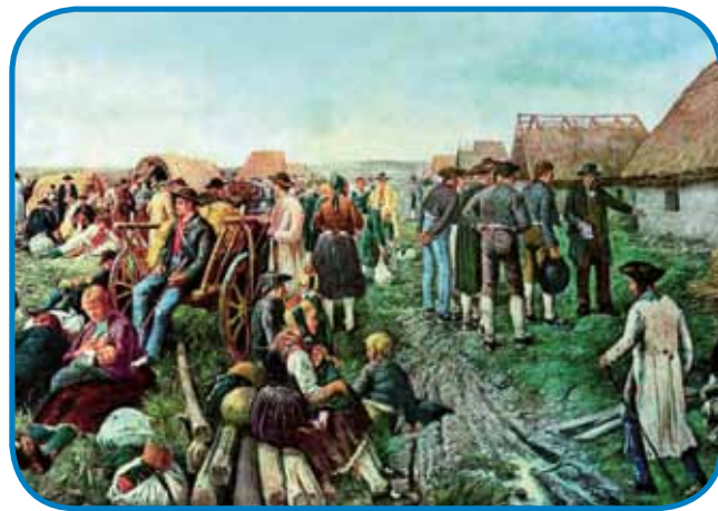
Cesari Karol III., Marija Terezija ino Jožef II. so na vöspraznjeno Vogrsko nutpozvali več stau gezero Nemcov («Švabov»)

Če rejsan je Karol III. vse pripravo za svojo čér, je včasik vövdarila bojna z drugimi