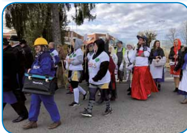
Sakalauvske maškare je pripelala vrla delavka s fabrike (županja)