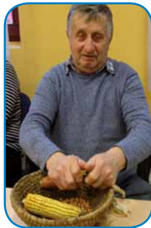
Pišti Majcan lüšči kukarce