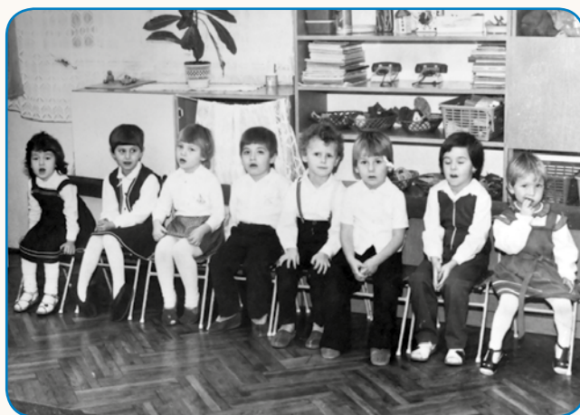
PREJK TELEFONA JE VSIKŠI VEČER VIDIM stran 8