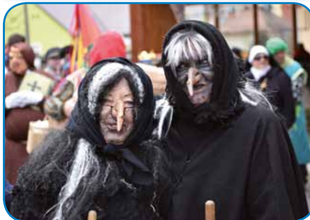
Té dvej sta gvüšno zagnali zimo ...