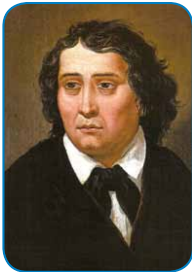
Franz K. von Goldstein, Portret F. Prešerna, 1850

pesnika se Slovenci niso mogli sprijazniti predvsem zaradi njegovega po vsej verjetnosti nerealnega izgleda. Slikar je žal Prešerna naslikal v nepravem trenutku pesnikovega življenja,