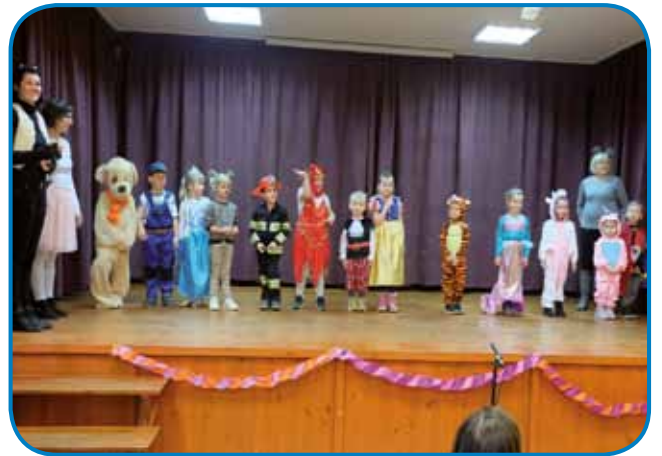
Mlajši pa vzgojiteljice so pripravili za fašenek primeren program samo v slovenskom geziki

dobili okajeno mesau pa na oli krumče, včüj pa krofline, steri so