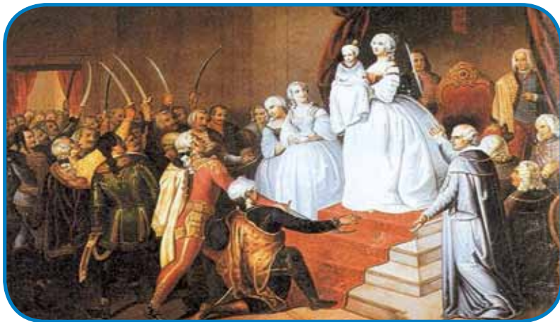
Ništerni pravijo, ka v črnóm gvanti, drugi, ka z detetom rokaj - Marija Terezija je leta 1741 prosila pomauč od madžarski stanov

Dosta Židauvov je tö prišlo v rosag: na konci 18. stoletja je