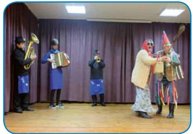
Fašenek pa Lenka sta visiko skakala, ka bi zrasla dugi len pa kusta repa; špilala njima je skupina Što ma čas

se do tistoga že lepou spekli. Etak so pa mauč pa volau tó dobili, ka bi se veselili pa zavrteli na muzi-