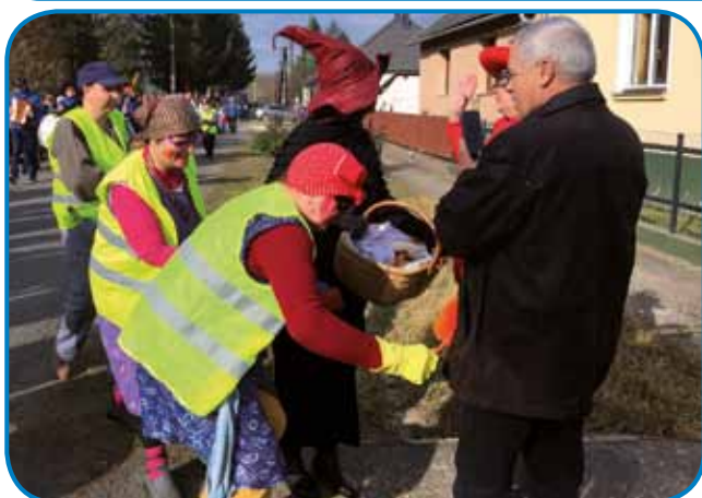
Zaman se je zagovornica zamaskérala, je nej vujšla flajsnim čistilkam