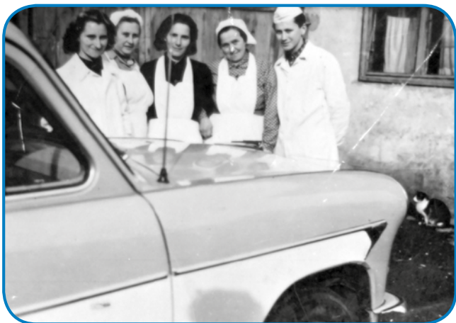
Mati, stera go, je gorzranila, je küjarca bila; s svojimi sodelavci v Varaši pred Koronov

nej gor, ka te sem se dja še nej naraudila, moj brat je edenajset lejt starejši, ta prva spauved je te bila, gda je on osem lejt star bejo. Dva starejša brata sem mejla, leko bi tak prajla, ka sem dja taša tjesna bejla. Gda sem se dja leta 1966 naraudila, za dvej leti je moja mati mrla, tak ka dja se na njau ranč ne spomnim. Mejla sem eden tjejp, gda ona name drži, depa zdaj sem ga nej najšla.»