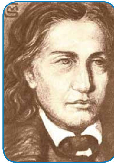
Maksim Gaspari, Portret F. Prešerna, risba, 1907-8