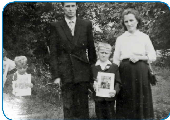
Mati pa oča s starejšim bratom po prvoj spauvedu

če v šaulo ali v cerkev dem, pa tašoga reda mi dostakrat na misli pridejo tisti, steri tam počivajo, gda mimo groba dem. Dostakrat pravijo, ka lüstvo dočas trbej poštüvati, dočas živejo, tau je istina,