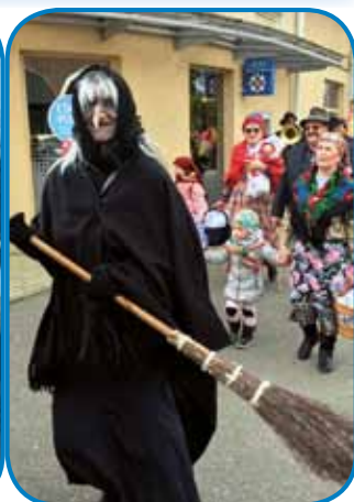
Čálarice so mogle lepau gorpomesti poštijo pred fašenkami