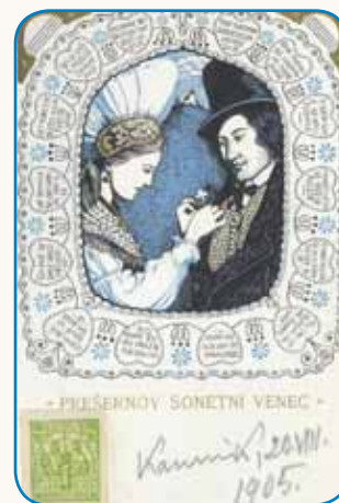
PORTRETI... stran 9