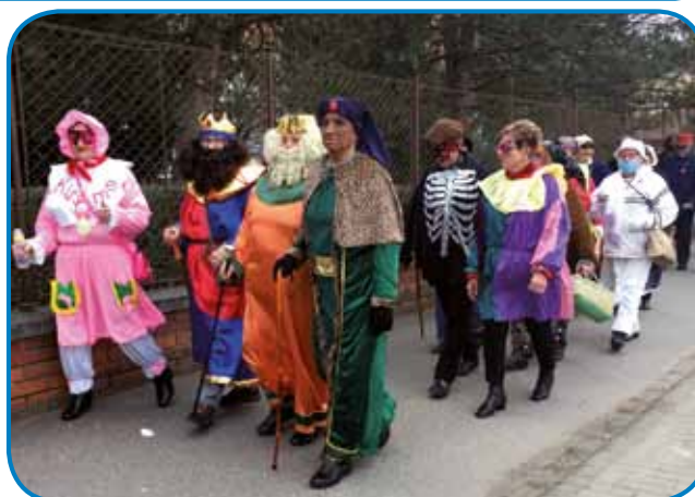
Trgé krali so malo žalostni, ka je konec fašenskoga cajta