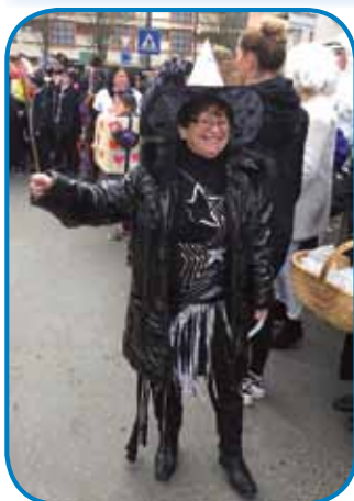
Zvezdina kralica je ovadila, ka že više dvajsti lejt odi na povorko