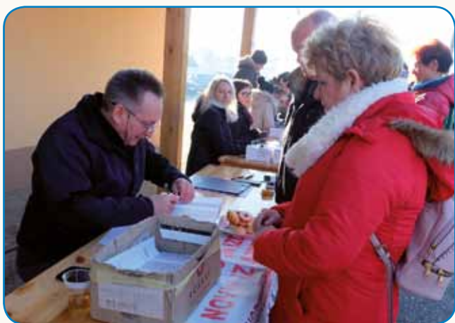
»NAŠI POHODI SO NEJ TEKMOVANJA« stran 4