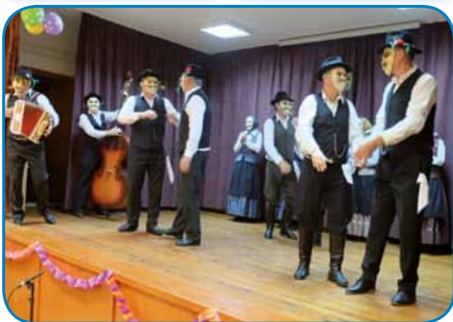
FS Podkolonca je prišla s Cankove

toga gnesnaden več ne držijo tak sigurno, dapa gnauksvejta so se ga rejsan držali naši predniki. Na letošnji fašenski torek (25. februar) je trno živo bilau v kulturnom daumi v Sakalauvaj, kama so lidi pozvali organizatorge prireditve, Slovenska zveza in sakalovska slovenska samouprava.