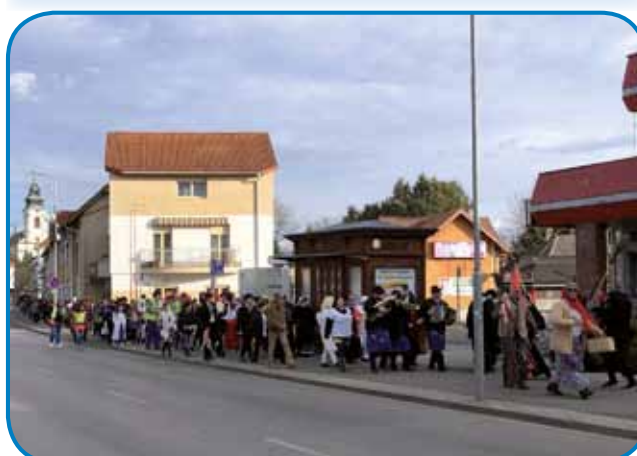
Fašenska povorka penzionistov je prinesla veseldje v Varaš