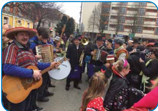
Združeni goslarje so v centri Monoštra pravo veselico naredili