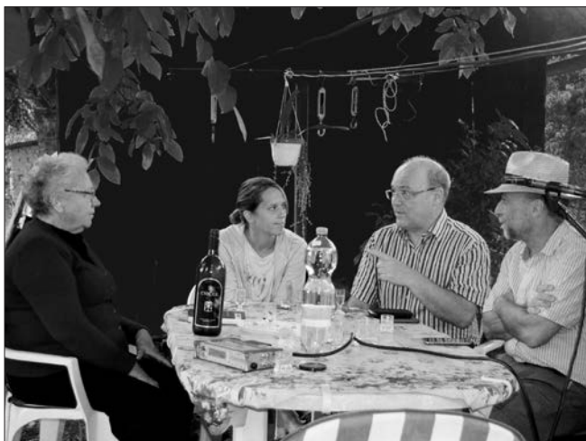
Člani raziskovalnega projekta Spomini religioznega v arhivih ljudske glasbe na prvem skupnem terenskem raziskovanju.

Foto: Urša Šivic, GNI ZRC SAZU, Gornji Senik, avgust 2017.