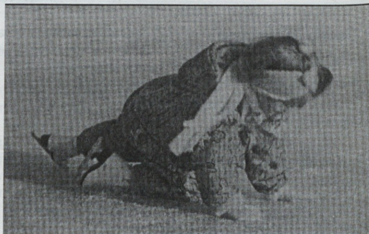
Uh, je gladko!