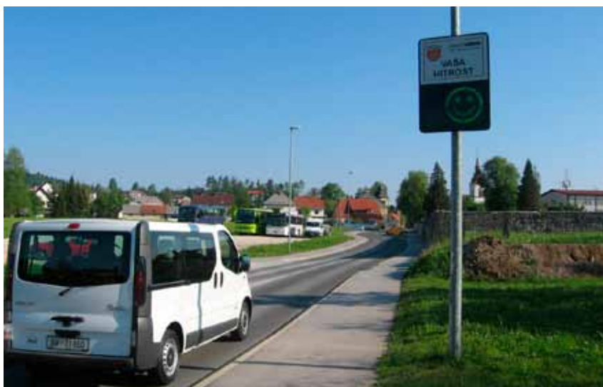
Policisti bodo še posebej pozorni na prehitro vožnjo v naseljih.

Po Tržaški, vse do Kalca, je kolesarska steza, zato kolesarje opozarjam, naj vozijo po njej,