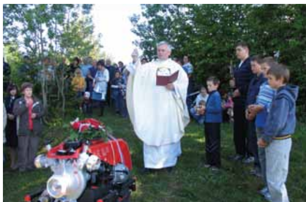
Blagoslovili so novo gasilsko motorno brizgalno.

S vetniku Florjanu, zavetniku gasilcev, je v podružnični cerkvi sv. Barbare na Ravniku posvečen levi stranski oltar. V počastitev njegovega goda, ki je 4. maja, je v njej vsako prvo majsko