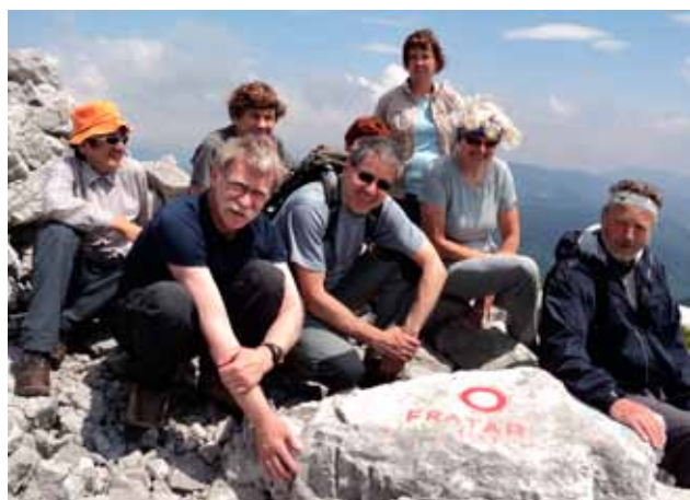
Logatčani na razglednem Fratarju.