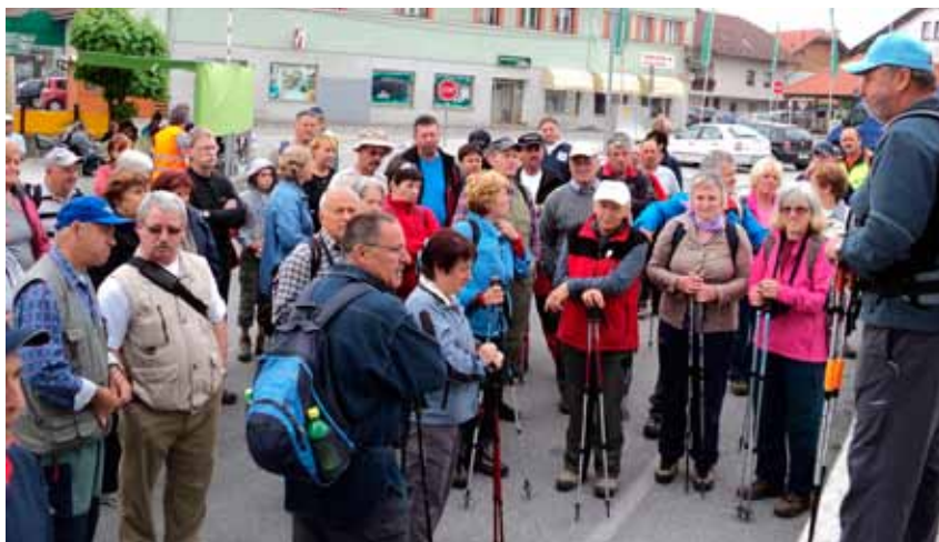
Pohod po Logatcu je pritegnil veliko ljudi.