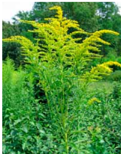
Zlata rozga se vse bolj širi, zlasti ob cestah in železnicah, na opuščeni njivah ter po gozdni robovih in bregovih voda.

Prva rastlina, katere odstranjevanje nam v Sloveniji nalaga predpis, je pelinolistna ambrozija. Je močno alergena in povzroča škodo v kmetijstvu, zato smo jo dolžni odstranjevati po vsej Sloveniji. Imetnikom zemljišč, na katerih se pojavi, predpis nalaga dve nalogi: ambrozijo morajo odstraniti – in to na lastne stroške –, in nato do konca septembra opazovati, ali se ni ponovno pojavila. Inšpektorat RS za kmetijstvo, gozdarstvo in hrano je lani, v prvem letu veljavnosti predpisa, prejel 125 prijav navzočnosti ambrozije. Največ so prejeli zaradi navzočnosti na njivah, zapuščenih gradbenih jamah in avtocestah, regionalnih