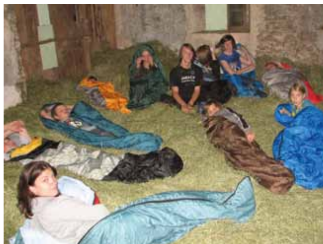
Spanje na senu je bilo posebno doživetje.

Ker smo bili zelo pridni in smo delo dobro opravili, smo za večerjo dobili odlično, na žaru pečeno meso s krompirjem in zelenjavo. Ker imamo tudi pri tabornikih strastne navijače, smo si pred spanjem ogledali tekmo Barcelone proti Manchesteru, nato pa utrujeni legli v seno. Mogoče pa le nismo bili zelo utrujeni, saj smo se še nekaj časa smejali in veselili. Zjutraj smo spakirali in odšli na bližnji hrib, kjer smo se razgledali po okolici. Gospodarjema smo se iskreno zahvalili – pa tudi onadva nam, saj sta bila navdušena nad količino dela, ki smo jima jo prihranili –, in se po taborniško poslovili od njiju.