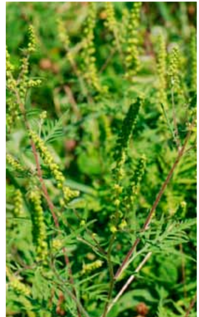
Pelinolistna ambrozija ima alergen pelod, zato je zdravju škodljiva. Najpogosteje jo najdemo na nasipih ob cestah in železniških tirih. Otroci naj je ne odstranjujejo.

ambrozije. Ker vsi prijavljeni imetniki zemljišč v letu 2010 še niso bili seznanjeni s predpisom, je inšpektor imetnika seznanil z zahtevami. Te so zbrane v zgibanki, ki jo je pripravila Fitosanitarna uprava RS. Inšpektor je imetnika naučil prepoznati ambrozijo in izrekel opozorilo zaradi nepravilnosti ter določil rok za njihovo odpravo. Imetniki so ambrozijo nato najpogosteje mehansko