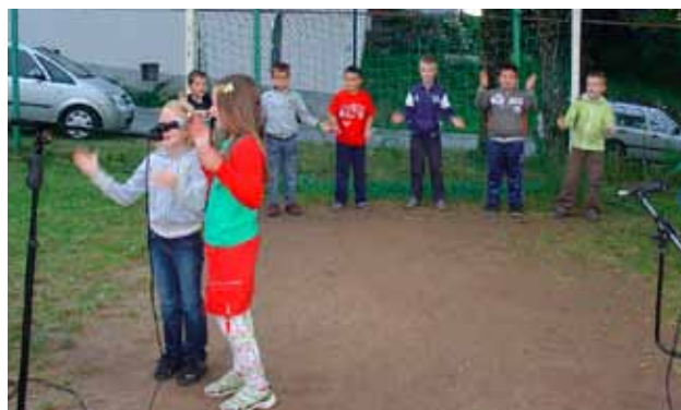
Pod lipo so nastopili tudi najmlajši.