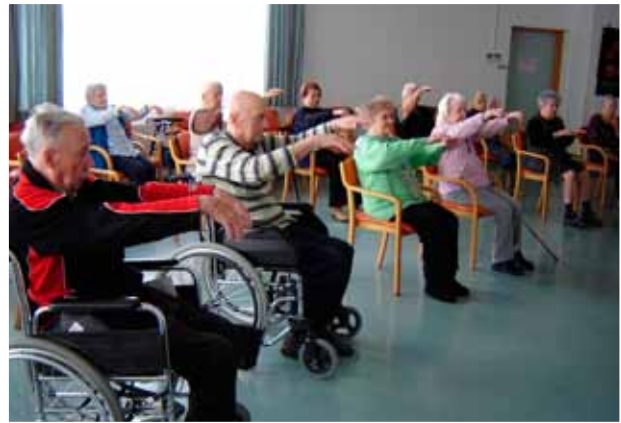
S kitajskima veččinama so se srečali tudi stanovalci doma starejših.