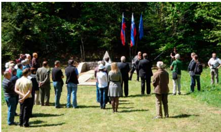
Na Vodica pod obronki Hrušice so se spomnili ruskih vojnih ujetnikov, ki so umrli med prvo svetovno vojno.