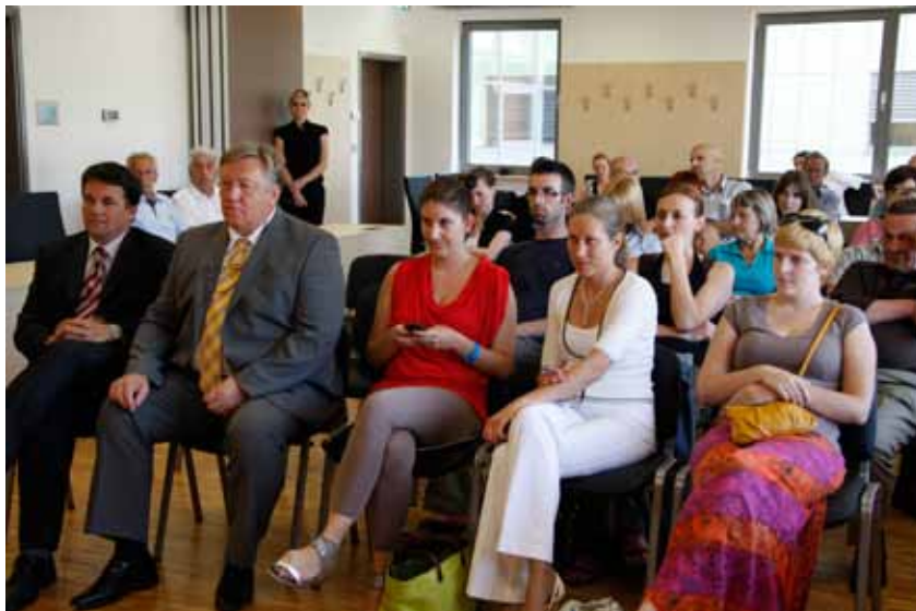
Z zanimanjem so prisluhnili okrogli mizi, na kateri je sodeloval tudi egiptovski veleposlanik.

Drugačen pristop je za svoj uvodni pozdrav izbral egiptovski veleposlanik v Sloveniji. Zgodbo trenutne politične situacije Egipta je popeljal nazaj, v obdobje, ko se je sam prvič in le v teoriji srečal s svetovnimi revolucijami. To je bilo v času njegovega srednješolskega izobraževanja, ko je za vsebino ene iz-