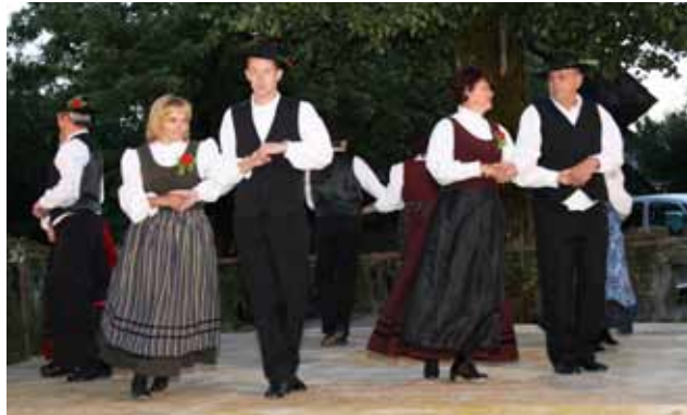
Hotenjski folkloristi so nabrusili pete.

Vaški trg pred cerkvijo sv. Janeza Krstnika v Hotedršici je zaživel 28. maja, ko se je izpod vaške lipe pozno v noč razleglo ljudsko petje, začinjeno s folklornimi plesi. Folklorna skupina Kulturno-turističnega društva Hotedršica, ki je bila pobudnik za prijeten večer, je v goste povabila številne nastopajoče, ki se že vrsto let trudijo ohranjati kulturno dediščino petja in plesa. Iz Sovodnja je prišla folklorna skupina, ki je z zanimivo odrsko