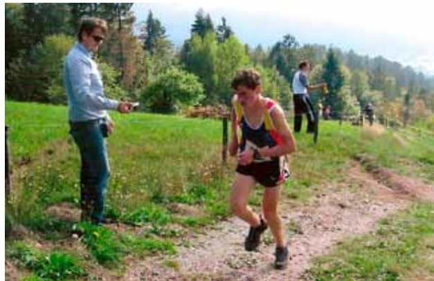
Le kdo ga lahko prehiti?

merilu. To mu bo gotovo uspelo, če bo le tako vztrajen, kot je. Letos je bil na pionirskih igrah v Turčiji peti na 800 metrov in šesti na 2.000 metrov. Kadar ne teče, s prijatelji brca žogo, kdaj pa kdaj zaigra pod koši, pozimi pa rad teče na smučeh ali spre-