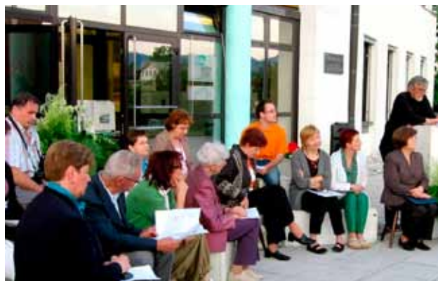
Literati iz društva Zeleni oblaki so junija svoje besede tkali pred knjižnico.