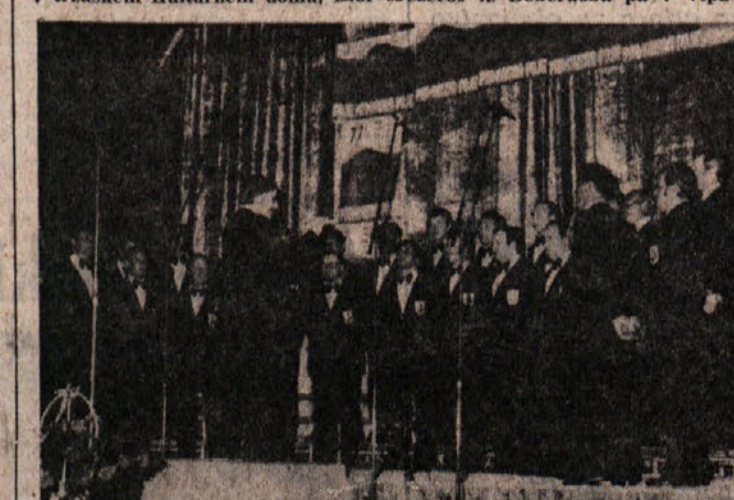
Zbor «Bilka» iz Bilovca na Koroskem ter komorni zbor «Zagari» iz Kroke na Gorenskem, ki sta nastopila v soboto v KD, sta bila v nedeljo gosta v boljuskem gledališču «P. Prešeren», kjer sta nastopila z vrsto pesmi. Med gosti in gostitelji so si izmenjali zdravice, voščila in darila

OVEN (od 21.3. do 20.4.) Svoje najboljše karte prihranite za najprimernejši trenutek. Utrdili si boste ugled v umetniškem krogu. BIK (od 21.4. do 20.5.) Z iskrenostjo si boste ustvarili več spoštovanja. Spoprimite se z nekim nevsječnim vprašanjem. DVOROJKA (od 21.5. do 22.6.) Dobro se boste prilagodili novi situaciji. Z intuicijo se boste obvarovali pred presenečenjem. RAK (od 23.6. do 22.7.) Ne boste imeli vseh elementov, ki so potrebni za doseg uspeha. Skušajte se razvedriti. LEV (od 23.7. do 22.8.) Znali ste boste sredi zmedenega vzdušja. Privoščite si nekaj počitka. Prijeten večer v krogu prijateljev. DEVICA (od 23.8. do 22.9.) Če želite, da bi vas kdo podprl, bodite bolj dostopni. Ne pripisujte nekemu vprašanju važnosti.