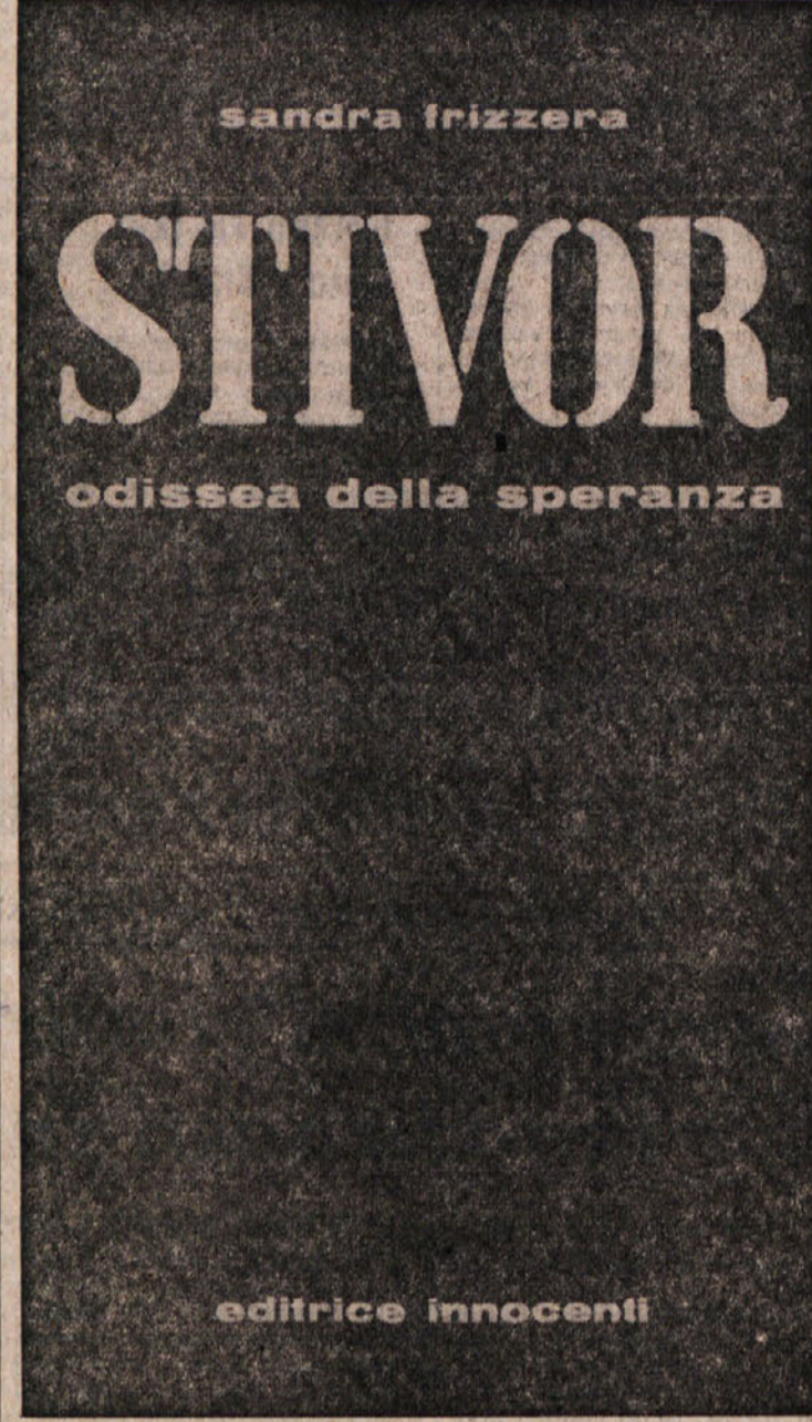
Naslovna stran knjige, ki govori o bosanskih Tridentincih

Poplava jim je pobrala vse in zato so se iz svoje Valsugane izselili Nekdo jih je napolnil v Bosno, kjer pa so morali prav vse začeti znova