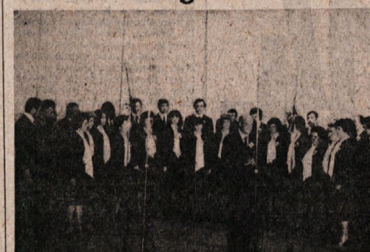
Preteklo soboto je bila na vrsti se manifestacija «Primorska pojes. Zbor «Slovenec» iz Borštni, ki ga vidimo na gornji sliki, je nastopil v tržaškem Kulturnem domu, zbor «Jezero» iz Doberdola pa v Vipavi