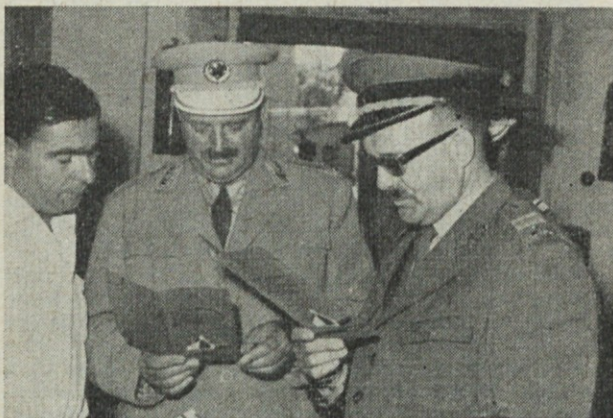
Visoka gosta iz JNA in LM si pozorno ogledujeta prospekt naših šotorov

Izvoz je bil vrednostno dosežen v maju 152,14 %. S tem je bil kumulativni plan za 5 mesecev 102,64 %. Prodaja gradla za žimnice ni bila v maju v celoti realizirana, ker niso bile vse naročene količine izdelane. To se bo v juniju in juliju nadoknadilo.