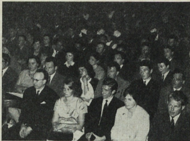
Preko 500 gostov v dvorani pozorno sledi sporedu ob zaključku jugoslovanskih športnih iger, katere je izvedel OSS Domžale za tekmovalce svojega območja

Štipendist v srednji šoli bo lahko prejemal od 12 do 16 000 din in štipendist na visoki šoli od 16 000 do 20 000 din mesečno. Višina je odvisna od gmotnega položaja štipendista, od njegove pridnosti in letnika študiranja.