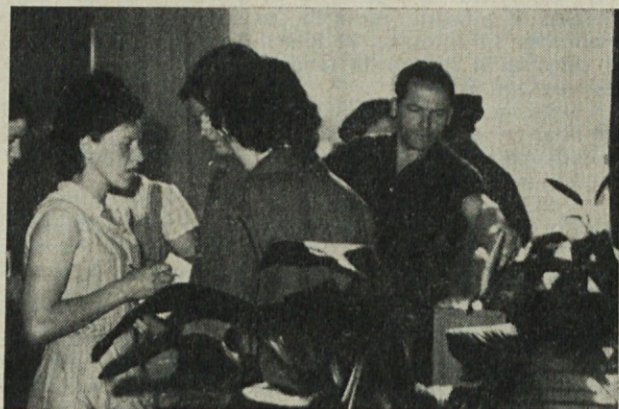
Na volišču št. 8 — uprava

Zaključna ugotovitev je, da proizvodnja ni izpolnila pričakovanj in da nas čaka v naslednjih mesecih resna naloga nadoknaditi zamujeno. V opravičilo pa navajamo, da nas nekoliko prizadene tudi redukcija električne energije v višini 10 %. Trenutno redukcijo ne moremo nadoknaditi niti z nočnim niti z nedeljskim delom, ker nam je dovoljena poraba energije določena.