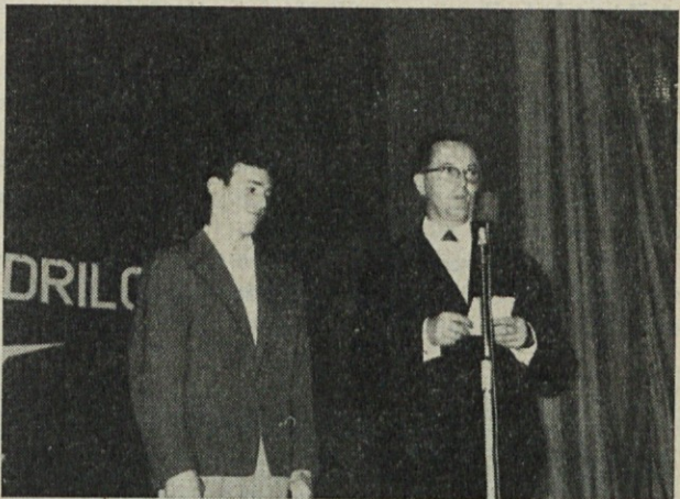
Svetovni prvak v orodni telovadbi Miro Cerar v Jaršah