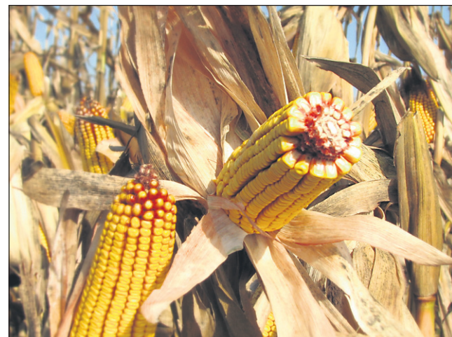
Nekateri izmed koruznih hibridov, ki so jih vzgojili v podjetju Pioneer, so bili na Klemenčičevih njivah vzgojeni prvič in bodo v prodaji šele čez dve ali tri leta.