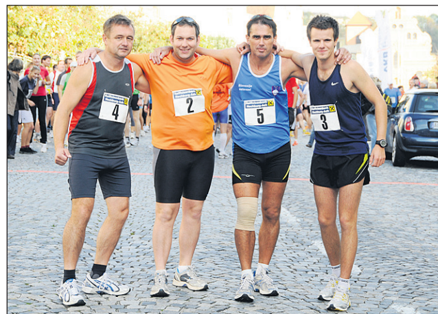
Člani Tekaškega kluba Maraton Ptuj na teku v Burghausnu.

Vabilu na 9. Salzach - Tek mostov v Burghausnu (9. oktobra 2009), ki je partnersko mesto Ptuj, smo se štirje tekači Tekaškega kluba Maraton Ptuj z veseljem odzvali.