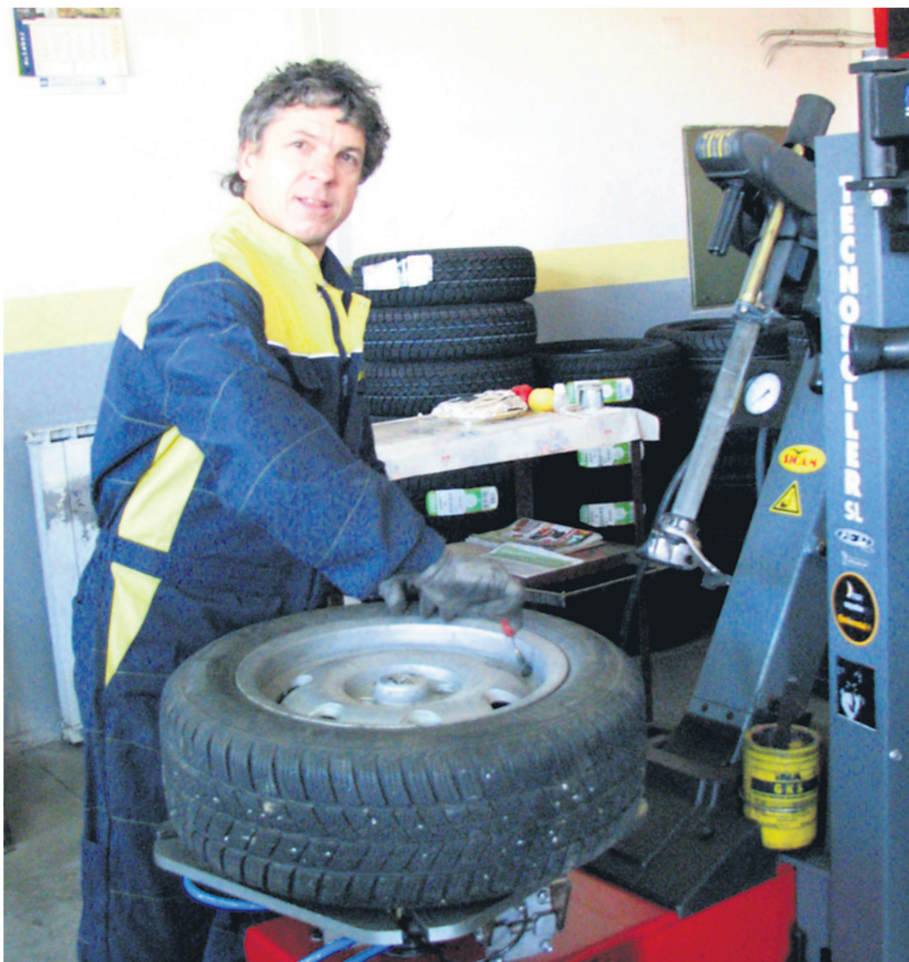
V Vulkanizerstvu Kosi v Ormožu so nekaj avtomobilov že preobuli, najhujši naval šele pride.

Zimske pnevmatike so označene tudi z zimskim indikatorjem obrabe (TWI-indikator). Ta nam pokaže, ali je pnevmatika še primerna za vožnjo v zimskih razmerah. Za lažje iskanje indikatorja je na robovih običajno trikotnik ali oznaka TWI. Zakonsko določena globina