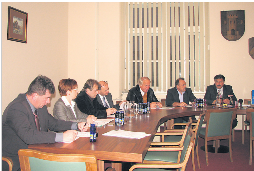
Sestanek o zakonu o razvojni podpori pomurski regiji v obdobju 2010 do 2015 je minil brez poslancev.

Na območju UE Ormož opažajo med brezposelnimi največji porast nekvalificirane delovne sile, ki je tudi naj-