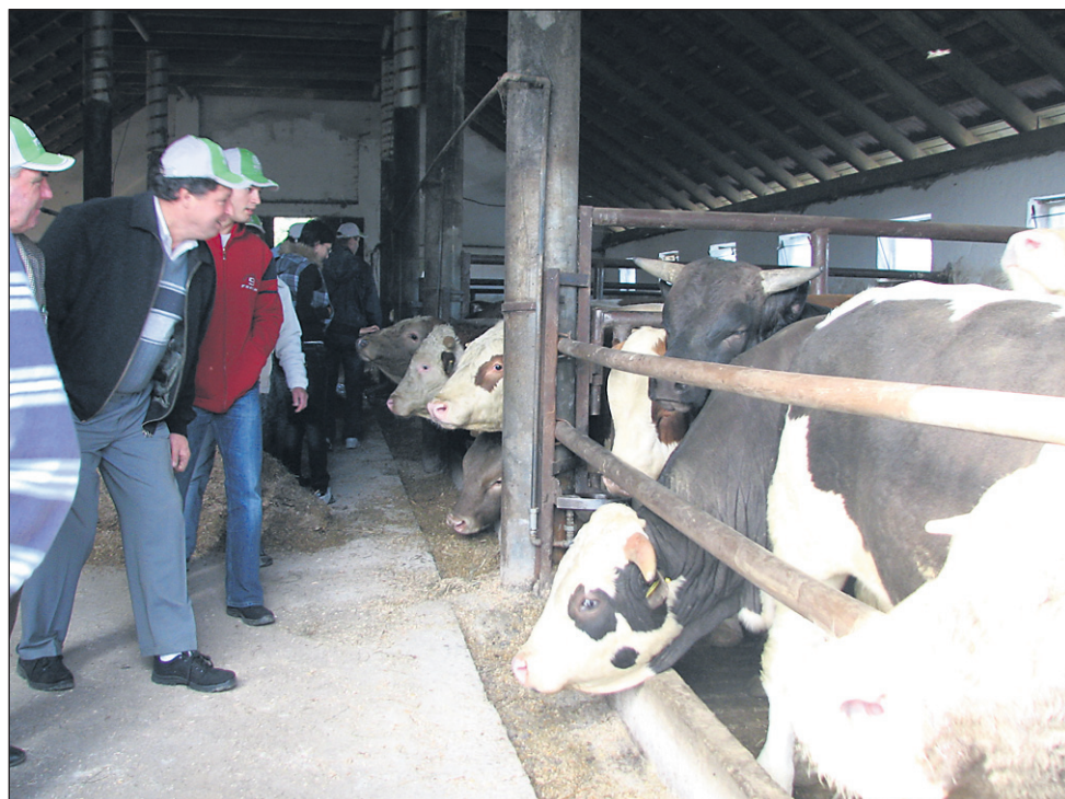
Na ogled so bili tudi Klemenčičevi hlevi; v njih je trenutno 68 glav govejih pitancev, vendar gospodar napoveduje gradnjo novega hleva in širitev črede.

»Danes razmere nikakor niso naklonjene čistim poljedelcem in samo s poljedelstvom se ne bo dalo pre-