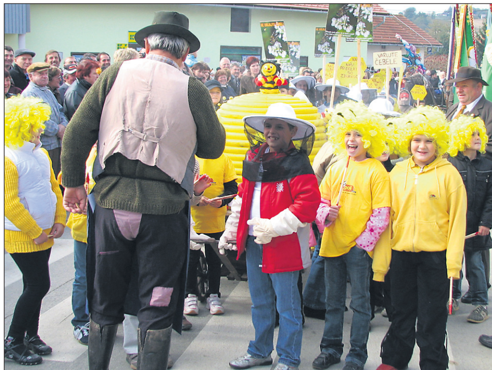
Za eno najbolj izvirnih in odkritih predstavitev samih sebe v povorki čebelarjev so poskrbeli kar otroci: »Ja, mi smo pa županove čebele!«

V okrožnici papež opozarja, da sistem gospodarstva, ki temelji zgolj na dobičku, tvega, da bo bogastvo uničil in proizve-