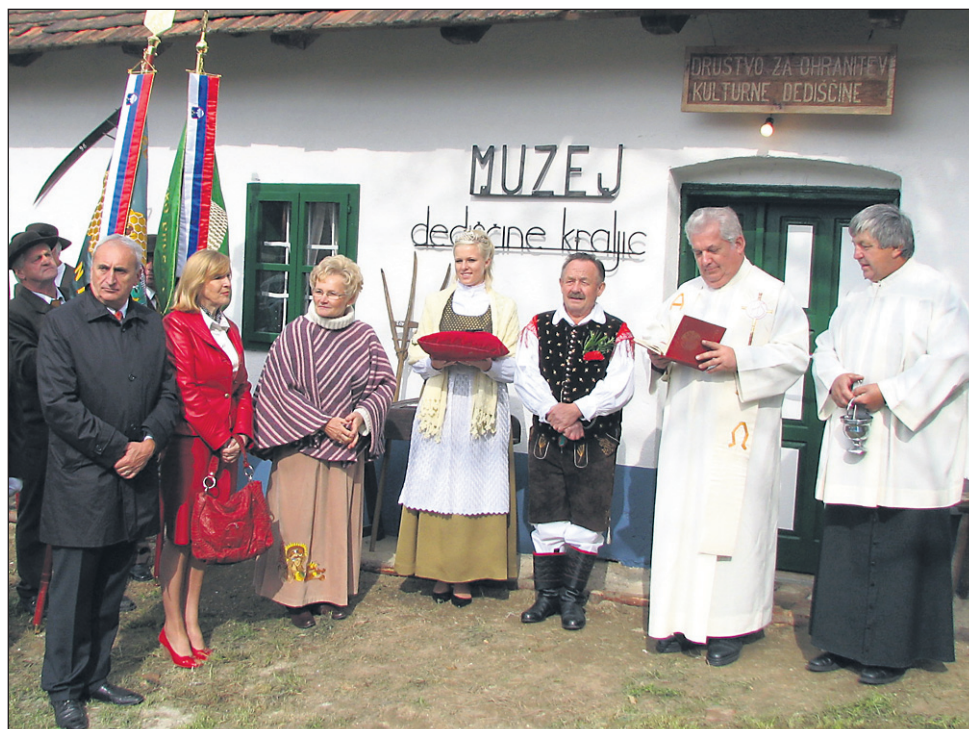
Letos so v Juršincih med praznovanjem tudi uradno odprli muzej dediščine kraljic, kjer je bila nekoč župnijska »štalinka«.