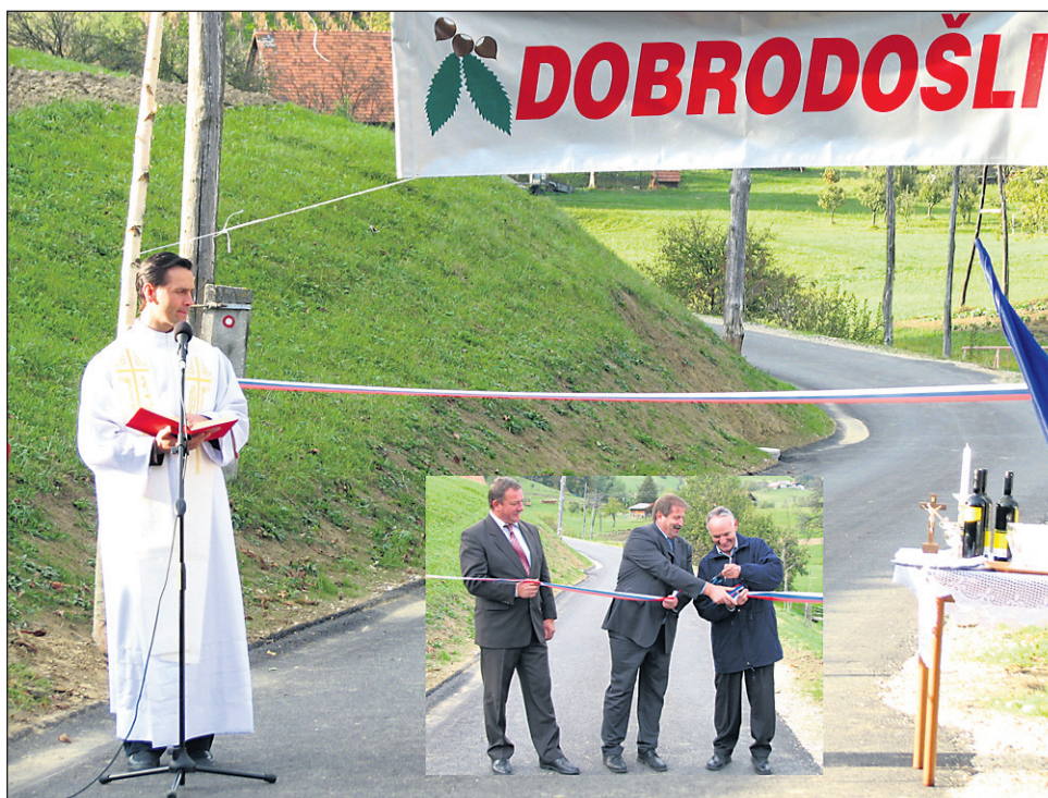
Fotografija ni simbolična ...

S tem je bilo uradnega dela govora osrednjega govornika, sicer mladega žetalskega župni-