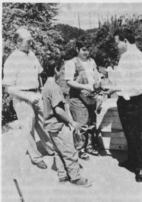
Mladi tekmovalci pa so prejeli darila.

Da smo Slovenci narod čebelarjev, ne dokazujeta le znamenita čebelarska strokovnjaka, kot sta bila Anton Janša in Peter Pavel Glavar, ampak tudi množičnost in čebelarski podmladek, ki smo ga minulo soboto z veseljem opazovali tudi na tekmo-