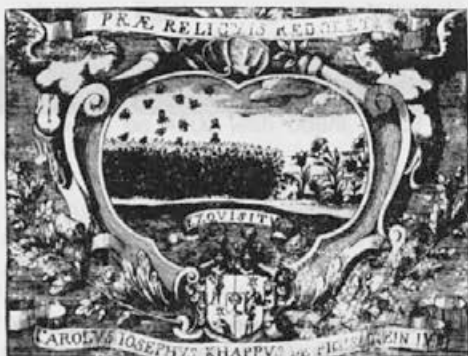
Večina grbov članov akademije je vsebovala čebele kot simbol marljivosti in vztrajnosti.