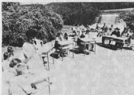
Med tekmovanjem na šolskem dvorišču.