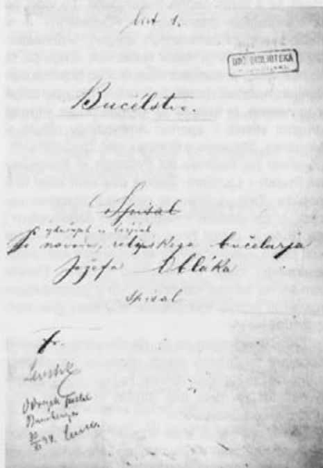
Prva stran Levstikovega rokopisa knjige Bučelstvo.