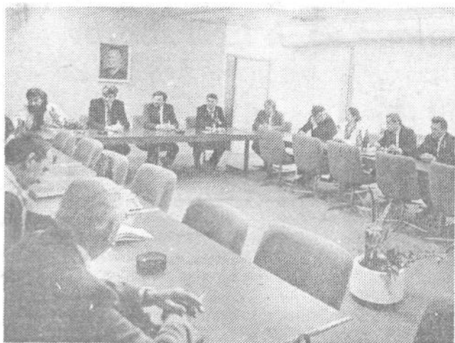
Obisk v Iliriji-Vedrogu