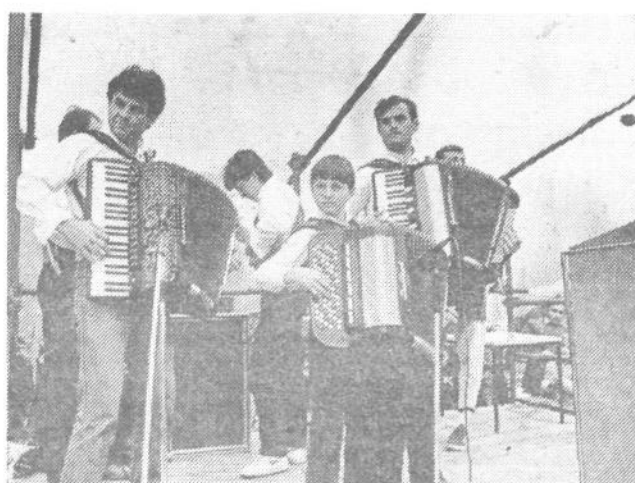
Ansambel KUD Dragajlo Dudič je razvel poslušalce