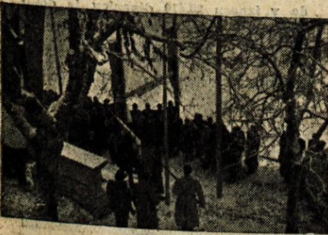
Ustavili so se tudi pred spomenikom talcev, ki so padli pred petnajstimi leti v herojski bitki ob napadu okupatorja na Dražgoše.

SO SE V DRAŽGOŠAH SPET SREČALI BORCI CANKARJEVEGA BATALJONA