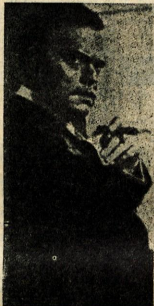
ZAKAJ TAKO MRKO? Orson Welles