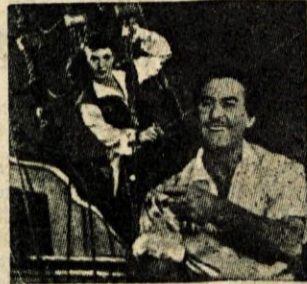
»LOMILEC SRC« Errol Flynn