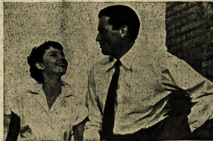
NAJPOMEMBNEJSI? Gregory Peck

pa se za otroka ni več brigala. Izročila ju je v varstvo svojih novi tašči, materi svojega novega moža pevca Dicka Haymessa, ta pa svojih sosed, »Društvo za preprečevanje krutosti proti otrokom« je Rito tožilo, toda slavna zvezda se je izmazala. Kot kos prtljage romajo otro-