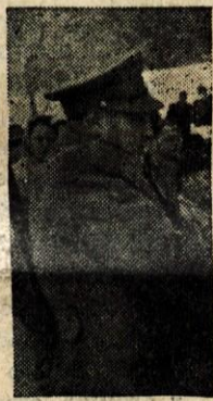
Narodni heroj Tonček Dežman se je poklonil spomenu svojih tovarišev.