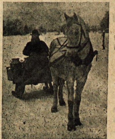
Kristanov »ata« je res prava gorenjska grča...

dim cigarete nama je vzbujal občutek tako potrebne toplote.