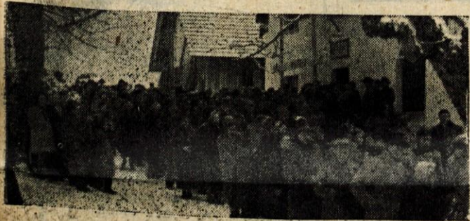
Gorenjci so se kljub slabemu vremenu udeležili sprevoda na grobove dražgoških žrtev.

GLASILO SOCIALISTIČNE ZVEZE DELOVNIH LJUDI ZA GORENJSKO