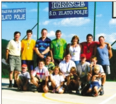
Najboljši na družabnih igrah