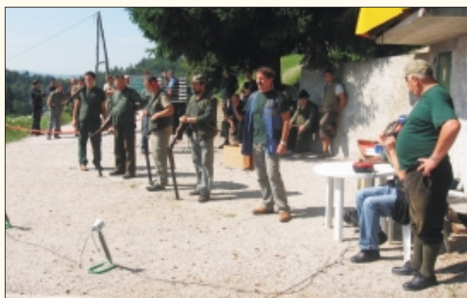
Strelci na svojih položajih