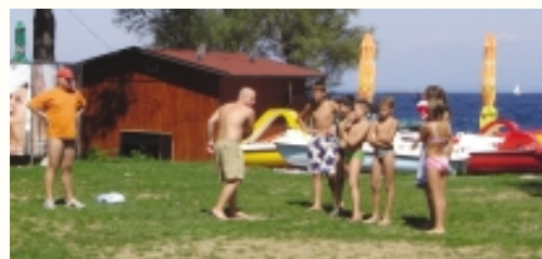
Tekmovanje v metanju 'frisbija'