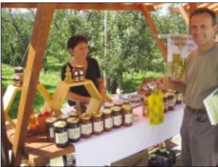
Na stojnici z medenimi izdelki si dobil vse, kar si iskal

Pravo podobo pa so jesen na polju predstavili domačini z bučami, ki so še redkost na deželi. Kmetovalci vedno manj redijo prašiče na star slovenski način, ki mu moderno pravimo bio hrana. Za popestritev pa so poskrbeli domačini, ki so s pomočjo starega 'gepelna' prikazali mletje jabolok. Kot se morda še starejši ljudje spomnijo, je bila v gepelj vprežena domača živina, ki je hodila v krogu, in tako poganjala preko zobnikov mlatilnice, slamoreznice in ostale domače pripomočke na kmetijah, ki so danes že izginili iz uporabe. Električna je sedaj že v vsaki hribovski kmetiji, zato so taki pripomočki vidni le še v muzejih širom po Sloveniji. Na ročni stiskalnici jabolok so sprežali – stisnili prvi jabolčni sok, ki so ga lahko poskusili vsi obiskovalci. Sadjarji z Brda so nam podrobno prikazali vrste jabolok in jablan ter zrelost sadežev. Sirarji pa so pekli njihove sveže sire na zelo domiselne načine z dodanimi začimbami. Verjemite, tako je bilo dobro, da si polizeš vse prste. Ob stojnici z medenimi izdelki, ki si jih lahko tudi kupil, so nudili vse, kar se da proizvesti iz medu.