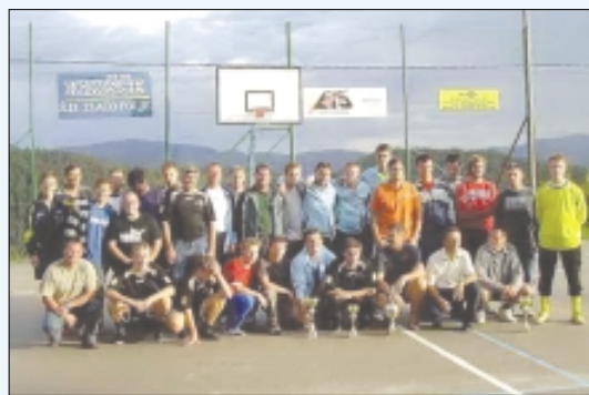
Skupinska slika najboljših ekip