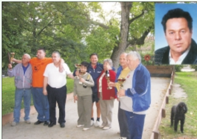
Vse ekipe so bile zmagovalne