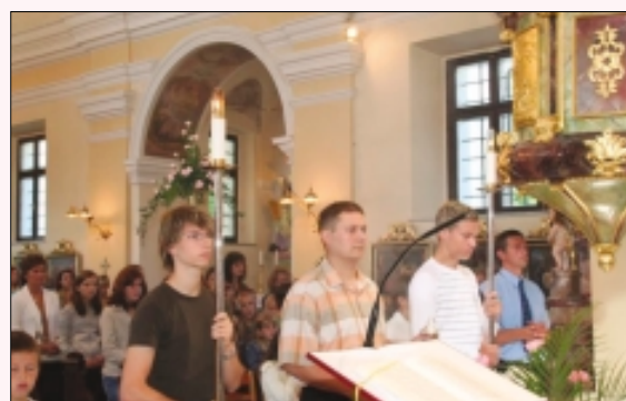
Veterani pri sv maši

beremo časopis, predvsem tisti rumeni tisk dve uri, na igrah presedimo uro dve in še bi lahko našteval, vendar pa zelo težko najdemo čas, da bi prebrali vsaj del Svetega pisma, prišli in sedeli v klopi pri sveti maši, si organizirali prevoz za spoved in tako kakor Jezus nam včasih tudi naš župnik govori na nenavaden način in tudi zato si je potrebno vzeti čas, da ga lahko razumemo. Verjetno je stavek iz njegovega nagovora sila pomemben in tudi sicer uporaben: "Kdor s svojimi ni v sozvočju – ljubezni, ampak v prepiru – sovraštvo, ne more biti Jezusov učenec." In kaj je bilo na tokratno nedeljo poleg božje besede in slovesnosti še doživeti, ob polni cerkvi veselih in nasmehanih obrazov vseh starosti, kar pomeni, da je še vera v Boga v nas? Po končani sveti maši, ko se je na koncu domači župnik zahvalil vsem ministrantom veteranom za služenje toliko let, je sledil še veseli del. Poleg slavljencev so bil na bob povabljeni še člani ŽPS, pevci,