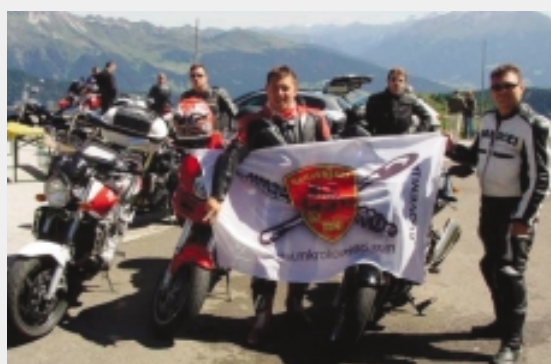
S klubskimi barvami na Dolomitih