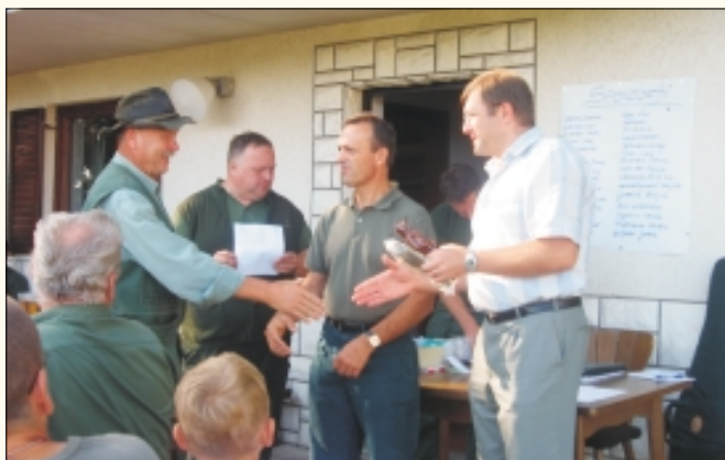
Podajanje nagrad najboljšim strelcem