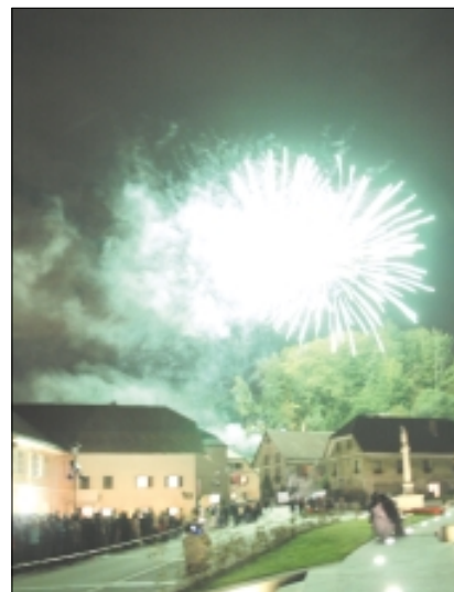
Slavnostno v občini Lukovica