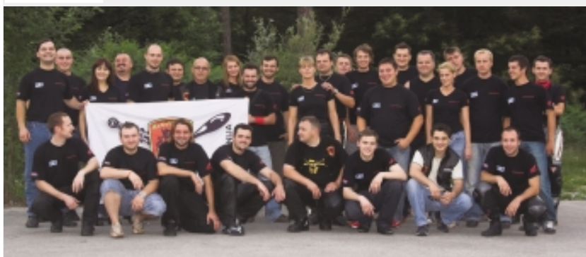
Skupinska fotografija pred nočno vožnjo