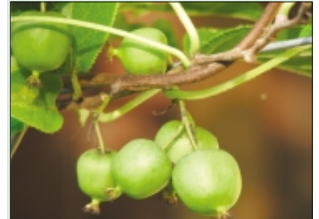
Drobni plodovi bavarskega kiviija prej dozori in niso dolgo obstojni

Kivi (aktinidija) je zanimiva plezalka, ki se je pri nas že kar dobro udomačila. Pred leti najprej na Primorskem, kasneje pa so začeli kivi gojiti skoraj po celi Sloveniji. Ne ravno za prodajo, toda za domačo uporabo ga je mogoče prideliti prav povsod. Kogar skrbi, da mu rastlina pozebe, si lahko omisli 'bavarski kivi'. Ta ima sicer mnogo manjše plodove brez dlačic, zato pa prenese tudi ekstremno nizke temperature. Le rastlina ni tako košata: ima manjše gladke liste.