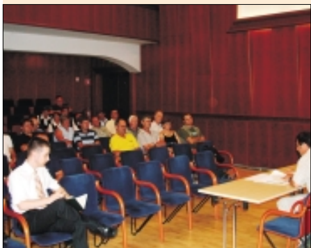
Ustanovni občni zbor