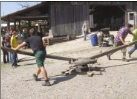
Predstavitve mletja sadja na stari gepel s pomočjo domačinov

Prvo soboto in nedeljo v septembru so bili na Brdu vsakoletni dnevi odprtih vrat. Sadjarstvo in njihove pridelke so predstavili strokovnjaki KIS, Kmetijskega inštituta Slovenije z Brda. Predstavili pa so se tudi čebelarji iz občine Lukovica s svojimi izdelki, revija Gaia z vso strokovno literaturo in ponudbo o sadjarstvu, vinogradništvu, poljedelstvu in vrtičkarstvu. Iz okoliša Litije so domači sirarji prinesli vrsto sirov.