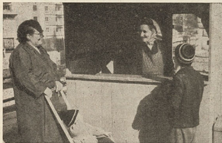
ZNAMENJE JESENI: Na obeh straneh mostu v Kočevju sta že dlje časa zeleni hišici kostanjarjev, ki ju Kočevjarji zelo radi obiskujejo

OPOMBA UREDNIŠTVA: Povprašali bomo na pristojnem mestu, kako je s kočevskim muzejem in odgovorili v eni prihodnjih števil.