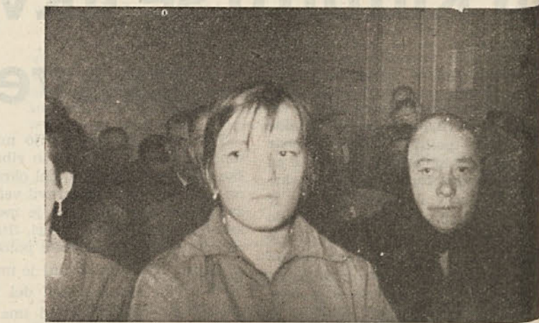
Razgovora o ustavi v Dragi se je udeležilo okrog 100 ljudi

Svet za blagovni promet je na zadnji seji o predlogu KGP razpravljal in sklenil, da se mu ne ugodi. Na podlagi zadnje statistične cen (od 22. do 28. 10.) so se člani sveta prepričali, da so cene mesu v Kočevju že zdaj enake, pa tudi višje (in le v redkih primerih nižje) kot v drugih slovenskih krajih. Kočevje, ki je