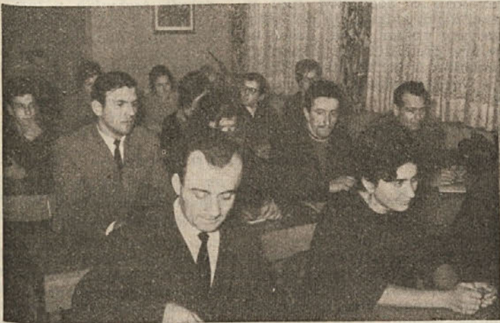
Delegati in gostje na letni konferenci Sveta svobod in prosvetnih društev občine Kočevje