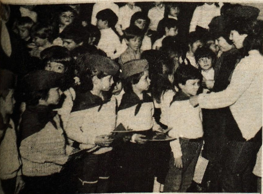
Danes, ko postajam pionir... — V dneh pred Dnevom republike so v vseh šolah po domovini najmlajše sprejemali v pionirsko organizacijo. Tudi cicibani z osnovne šole Staneta Žagarja na Planini so na slovesnosti ob rojstnem dnevu domovine svečano zaprile, da bodo poleg dobri učenci in zglejni člani samopravne družbe. K temu jih veda tudi pionirska zaprisega, ki so jo izrekli pred pionirsko zastavo.

Kranj — V lutkovnem gledališču v gradu Kiselstajn bo v četrtek, 6. decembra ob 15,30 in ob 16,30 gostovala lutkovna skupina Ljubljana-Bežigrad z lutkovno igrico Lev in miška.