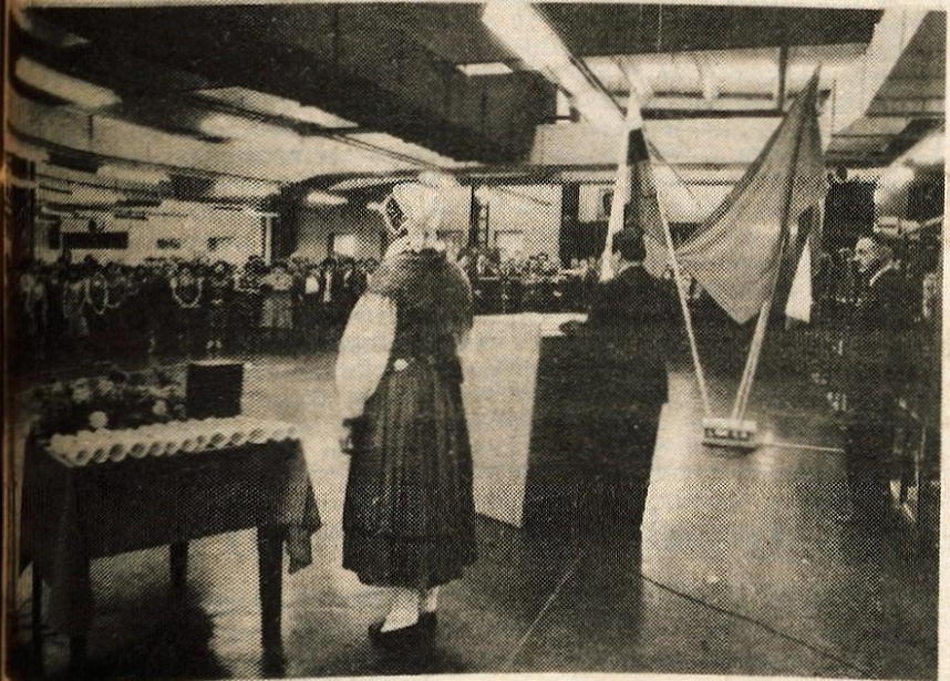
Pravno, dan pred praznikom republike, so v kranjski Planiki odprli nov obrat izdelovanje športne obutve.

Kranjski Planiki so pred praznikom republike odprli nov obrat izdelovanje športne obutve po posebni tehnologiji direktno vbrizganih podplatoz iz poliuretana. V njem bodo na leto naredili za zahodnonemškega partnerja Adidas 1,5 milijona parov ali 500 parov več kot prej. S tem bodo vrednost izvoza povečali z 11,2 na 15 milijonov dolarjev.