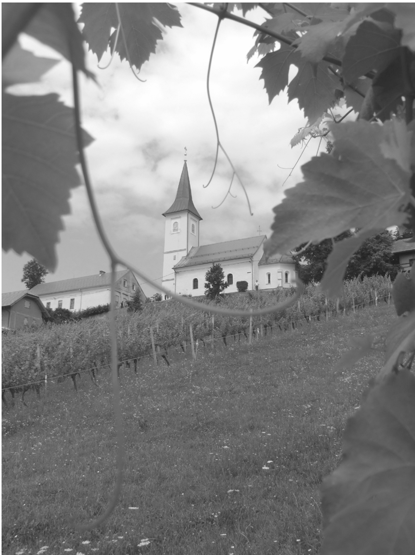
Humski Janez Krstnik, pogled z vzhoda.