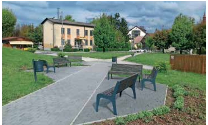
Mali park v Logatcu

Lansko leto se je začelo z mrzlim januarjem in končalo s sneženim decembrom. Zaznamoval ga je vetrolom, ki je podrl še tista drevesa, ki jih nista uničila žled in lubadar. Vmes pa smo imeli (pre)zgodnjo pomlad in dolgo suho poletje, ki se je z »babjim poletjem« zavleklo v jesen. Toliko o lanskem vremenu, kar si je vredno zapomniti, saj g. Kaplan pravi, da bo letošnje vreme podobno lanskemu. Zopet naj bi imeli zgodnjo pomlad – že konec februarja, nekaj dežja bo marca, pa tudi aprila, ki naj bi upravičil svoj sloves tipično muhastega vremena. Podobna je tudi napoved vremenskega portala AccuWeather. Poletje naj bi bilo torej zopet toplejše od dolgoletnega povprečja – nadaljuje se trend (pre)toplega vremena v tem stoletju. Pogosto se bodo menjavala vroča in hladna obdobja, nevihte z močnim vetrom, poplave, po drugi strani pa visoke temperature. Napovedi pa imajo napako: ne ponujajo točno določenih datumov, na podlagi katerih bi lahko načrtovali dopust in druge aktivnosti na prostem. Tudi z vremenskimi pregovori si ne moremo kaj prida pomagati. Nekaj jih vseeno posredujem: