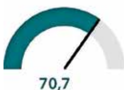
Indeks zadovoljstva 2017

Indeks nam pove, v kolikšni meri občinska uprava zadovoljuje svoje uporabnike. Višji kot je indeks, bolj so zadovoljene potrebe anketirancev.