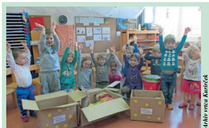
Arhiv vrta Kurirček