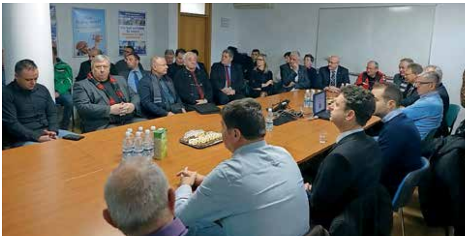
Podelitev prikazovalnikov hitrosti