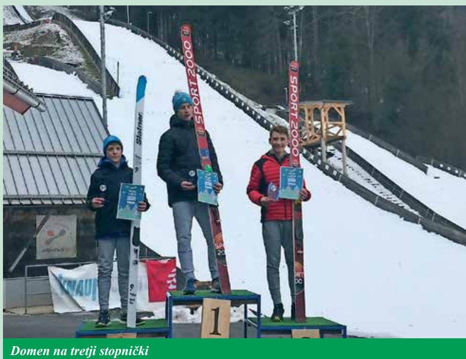
Domen na tretji stopnički

Besedilo in foto: Peter Petkovšek, SSK Lovci na daljave