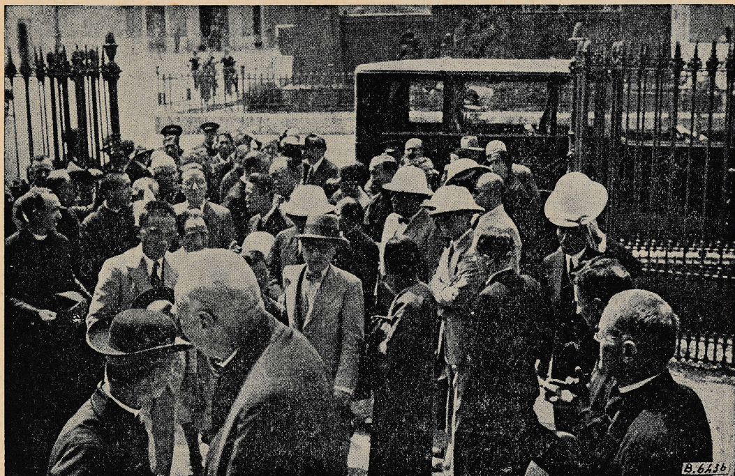
Naš vrhovni predstojnik sprejema kitajske romarje pred baziliko M. Pom. v Turinu

Kitajski romarji pri M. Pom. v Turinu. — 19. junija so prispeli kitajski romarji v Turin. Takoj naslednji dan so šli v Val-