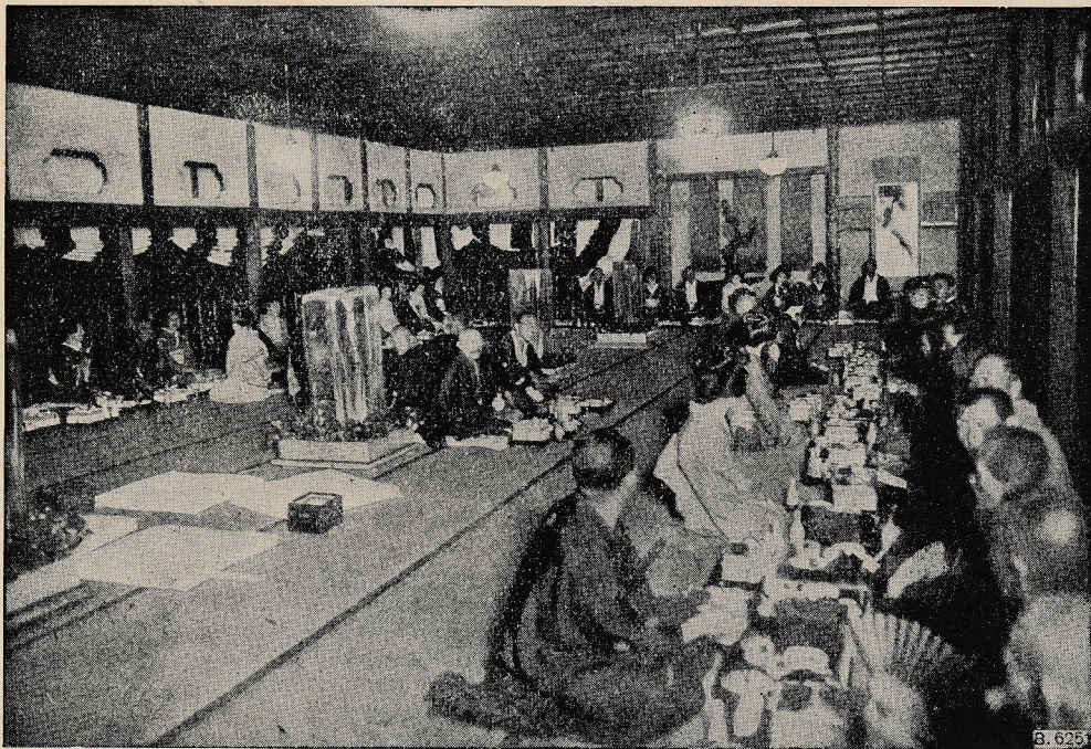
Svatbena gostija na Japonskem

Otroci zahajajo k nam, po večini šolarčki ljudske šole, da pri nas napravijo šolske naloge in se nauče, kar jim je naloženo, doma jim je tako nemogoče, saj nimajo povečini kje, manjka razsvetljave