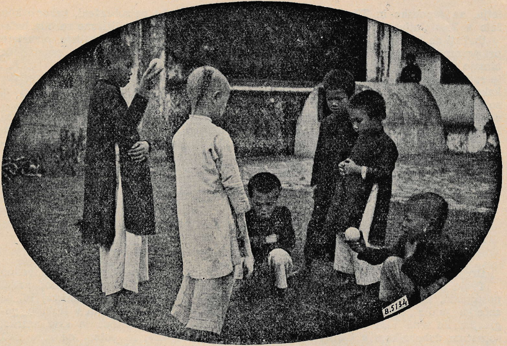
Najbolj priljubljena igra Kitajčkov