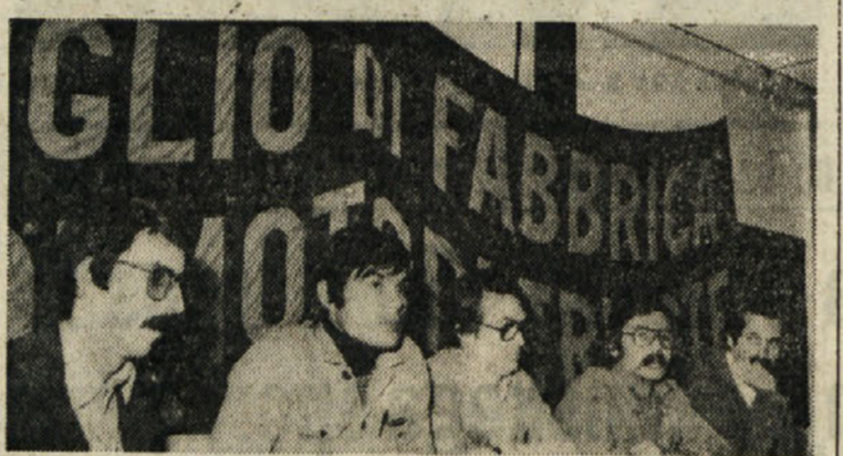
Z včerajšnje tiskovne konference v tovarni velikih motorjev

Z tega, kar so povedali člani tovarniškega sveta, je predvsem razvidno, da se delavstvo GMT bori v prvi vrsti za to, da bi tovarna prevzela mesto, ki ji dejansko pripada v krajevnem in širšem gospodarstvu. S svojimi 3.300 zaposlenimi delavci in sodobnimi tehničnimi napravami je Tovarna velikih motorjev pri Boljuncu drugi pomembnejši industrijski obrat v naši deželi in hkrati eden izmed najmodernejših v Evropi. Obrat proizvaja dieselske motore različnih vrst in razsežnosti — od tega 40% za ladje in preostalih 60% za različne pogoje na kopnem (generatorske, itd.). V tem trenutku so njegove proizvodne zmogljivosti izkoriščene v razmerju le 60 do 70%, in to kljub naraščajočemu povpraševanju po dieselskih motorjih po vsem svetu. Energetska kriza je namreč dotisnila v ozadje uporabo turbin in povečala zanimanje za dieselske motore, kljub temu pa se proizvodnja v tovarni nikakor ne more razviti tako, kakor bi njene tehnične naprave dovoljevale in kakor bi zahte-