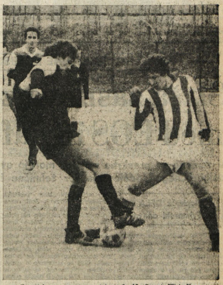
Posnetek s prvenstvene tekme 2. AL Campi Elisi - Kras

Julia - Virtus Volley 3:1; Celnia - Breg 1:3; CUS Trst - Rivignano 3:0; Intrepida - Sloga 3:1;