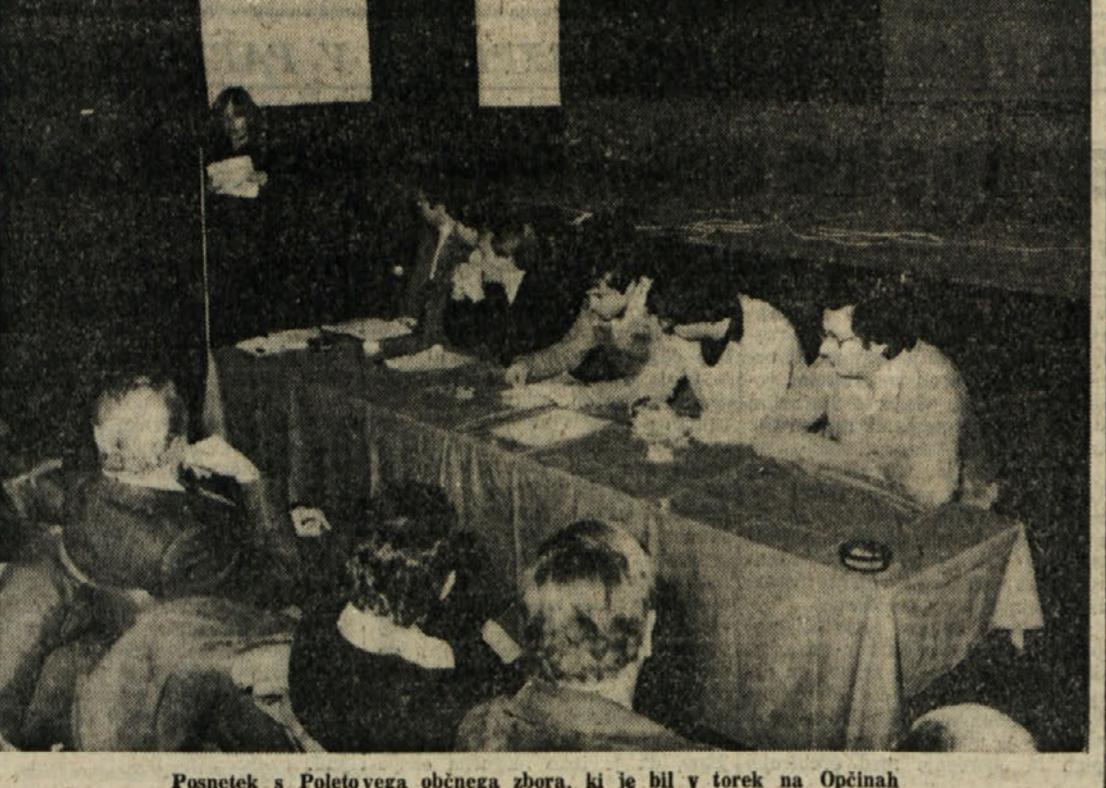
Posnetek s Poletovega občnega zbora, ki je bil v terek na Opčinah

Sestane predstavnikov goriskega dela ZSSDI V terek so se v Gorici sestali predstavniki goriskega dela ZSSDI, ki je obširneje razpravljalo o nadaljnjem delu združenja na Gorškem v okviru posameznih komisij in drugih pomembnejših akcij. Na sestanku je bilo v zvezi z akcijami precej govora o obisku telesnokulturnih delavcev z novogoriškega območja pri gorških športnih društvih (obisk je predviden v sredini meseca februarja), o plavalnem tečaju v bazenu v Novi Gorici (predvideva se poleg tečaja za najmlajše, ki je že v teku, še tečaj za odrasle neplavalce) ter o drugih akcijah, ki jih nameravajo posamezne komisije športnih panog izvesti v okviru 10-letnice ZSSDI. Poleg tega je bil tudi govor o organizaciji ZSSDI, s posebnim poudarkom na gorško pokrajino.