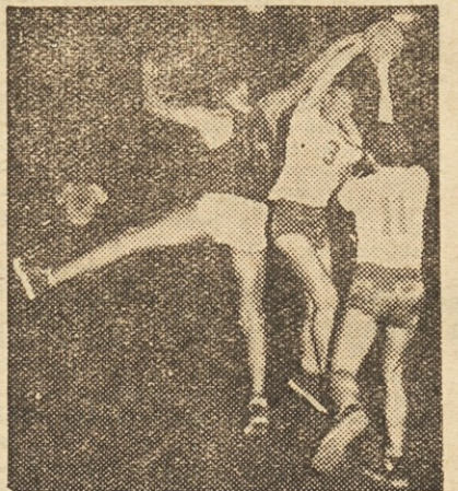
Prizor s tekme Olimpija : Ljubljana

Rezultati 17. kola: Ljubljana : Olimpija 64:59 (31:34), Crv. zvezda : Partizan 77:68 (39:45), Proleter : Mladost 95:67 (58:33), Montažno : Maribor 86:58 (39:20), BSK : Lokomotiva 46:42 (27:22).