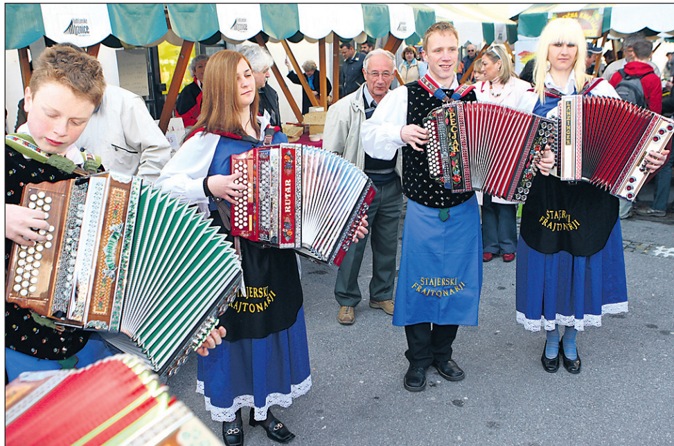
Štajerski frajtonarji iz Hajdoš so navdušili Ljubljančane.

meščani lahko v živo videli, kakšne vse dobrote »proizvaja« slovensko podeželje.