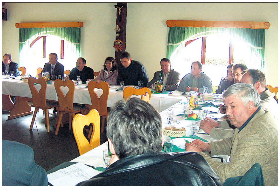
Na srečanju zadrug podravske regije je beseda tekla tudi o dveh zakonih – novem zakonu o zadrugah, ki je že v obravnavi, in nujno potrebnem zakonu o promociji.

Stalna tema pogovorov je tudi odnos med združniki in zadrugo. »Kar se tiče tega razmerja, je jasno, da si v zvezi želimo čim večje in čim boljše sodelovanje med člani in zadrugo, sam konkreten obseg sodelovanja v posameznih zadrugah pa določajo zadrुžna pravila. Menim, da je prav, da je v teh zadrुžnih pravilih zapisano, da mora vsak član v večjem delu proizvodnje sodelovati z domačo KZ. To sicer pri nas še ni stalna praksa. Za vzgled so nam lahko skandinavske države, saj tam kmetje z vso svojo proizvodnjo sodelujejo z izbrano zadrugo. Tega, da bi se tam kmet s svojimi proizvodi pojavljal »malo tu in malo tam«, ne poznajo,