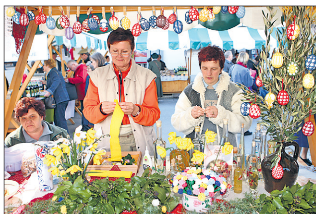
Na stojnicah je bilo videti tudi izdelovanje presmecev in pirhov.

Predstavitve je organizirala Kmetijsko-gozdarska zbornica Slovenije v sodelovanju z Ljubljanskimi tržnicami. Imela je tudi predpraznični utrip, saj so ob tej priložnosti predstavili tudi izdelovanje velikonočnih butar, pirhov in tradicionalnih velikonočnih jedi. Na številnih stojnicah za ljubljansko stolnico pa je bilo mogoče videti znamenite ljubljanske butarice in oljčne vejice. Teden dni pred veliko nočjo namreč potekajo številni blagoslovi snopov in šopov pomladanskega zelenja. Združenje staršev in otrok Sezam pa je v sodelovanju z nekaterimi društvi pripravilo priložnostne otroške delavnice. Nastopile so številne glasbene in kulturne skupine iz cele Slovenije, s Ptujskega so Ljubljančane zabavali Štajerski frajtonar-