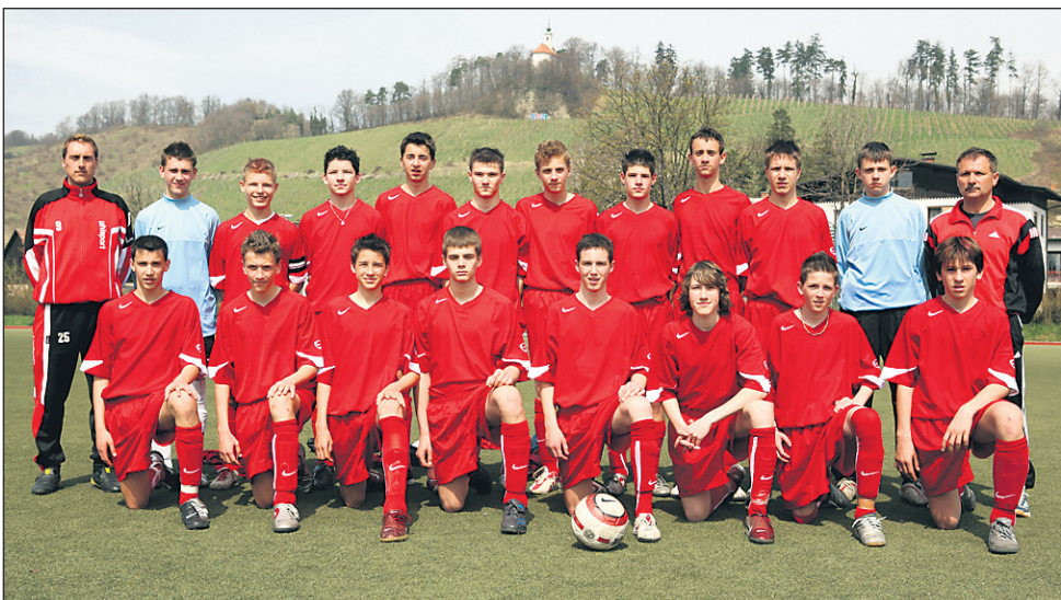
Zmagovalci finalnega turnirja Premier Cup Slovenije, ekipa Aluminija iz Kidričevega