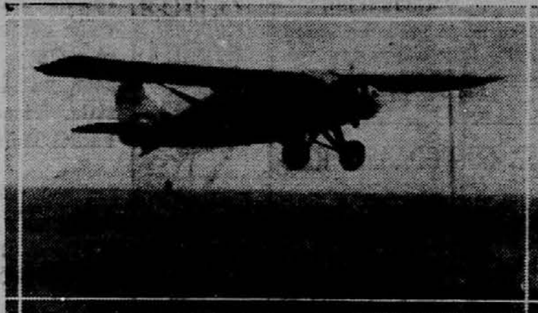
v katerem sta završila Chamberlin in Levine svoj zgodovinski polet.