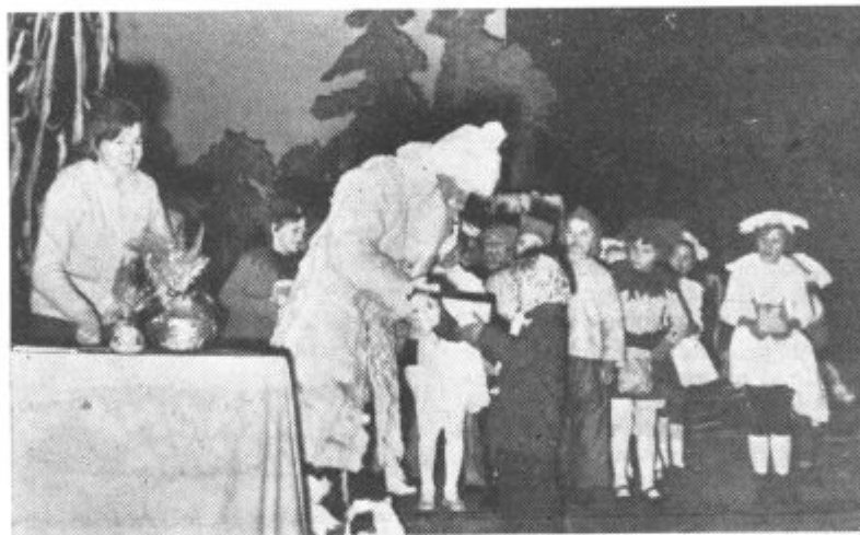
Dedek Mraz se je z vrhano koša ro ustavljal tudi v Cerkevniku, kjer je razveselil z lepimi darili naše najmlajše.