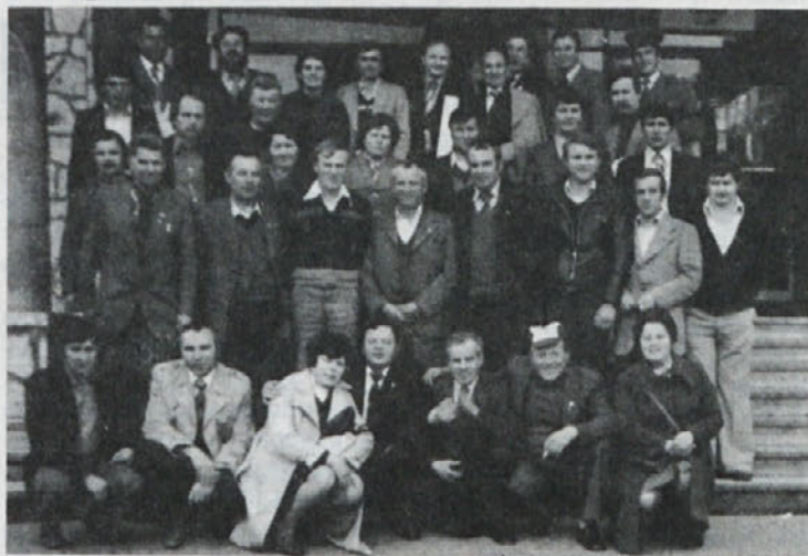
Krvodajalci občine Trebnje, ki so v Ilijašu darovali kri.