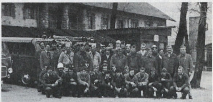
Slika: GASILCI Gasilci, ki so sodelovali pri nedavni gasilski vaji v IMV na Mirni.

ohranjali materialne dobrine in preprečevali poškodbe delavcev – občanov, je potrebno v tej smeri usposabljanje naše delavce in jim zagotavljati določeno opremo in tehnična sredstva.