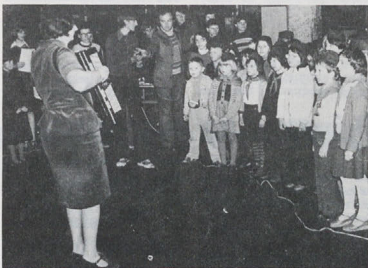
Za praznik dela so v IMV TOZD Mirna organizirali v porizvodnem obratu prisrčno proslavo na kateri so nastopili mirenski šolarji.