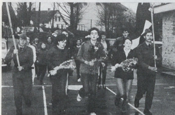
Prihod zvezne Titove štafete na Mirno

stranko za Hrvaško in Slovenijo. Ta stranka je združevala delavce vseh strank in je bila za tiste čase najnaprednejša. Leta 1914 je Avstro-Ogrska napovedala Srbiji vojno. 1917 leto je prineslo usodne revolucionarne dogodke, to je leto februarске in oktobrske revolucije, strmoglavili so carja in Lenin je stopil na čelo nove, sovjetske države. Tovariš Tito je pazljivo spremljal dogodke, se učil ruščine in mnogo bral, doumel je težnje in smotre mogočne bitke, ki sta jo vodila Lenin in boljševiška partija.