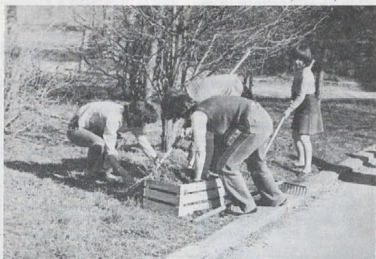
Pred prvomajskim i prazniki so stanovalci stanovanjskih blokov od 129 do 133 organizirali čiščenje okolice blokov

kdaj bo hišni svet razglasil akcijo čiščenja okolice. V teh primerih bi morali biti stanovalci