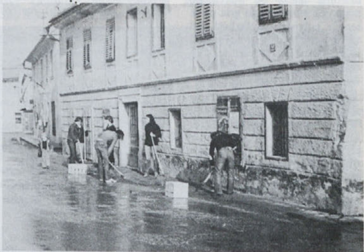
Mirenska mladina je konec aprila letos organizirala čiščenje svojega kraja

Torej, kolektiv „DANA“ Mirna si za mesece, ko običajno