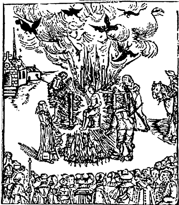
Usmrtitev duhovnika Urbaina Grandiera, obtoženega čarovništva v aferi »hudičev iz Loudona« (1634)

Kar zadeva čarovništvo kot najbolj izpostavljeno vejo zgodnjenovoveškega praznoverja, so pravno podlago za njegovo preganjanje v notranjeavstrijskih deželah, kamor je s svojimi župnijami segala ljubljanska škofija, 44 prinašali zlasti kazenski zakonik in postopnik za nemško cesarstvo iz leta 1532 in pa deželskosodni redi za posamezne dežele, izdani v letih 1535–1577. 45 Medtem ko denimo red za deželska sodišča na Kranjskem (1535) čarovništvo opredeljuje bolj ohlapno – kot »čarovnije, ki so po pravu prepovedane« –, 46 ločuje zakonik Karla V. ( Constitutio Criminalis Carolina ali Karolina) med škodljivim in neškodljivim čaranjem; za prvo predpisuje smrt »z ognjem«, za drugo pa kazen, ki naj se po posvetu sodnikov določi za vsak primer posebej. 47 »So jemandt den leuten durch zauberey schaden oder nachtheil zufügt, soll man straffen vom leben zum todt vnd man soll solche straff mit dem feuer thun. Wo aber jemandt zauberey gebraucht, vnd damit niemandt schaden gethan hett, soll sunst gestrafft werden, nach gelegenheyt der sacht, darinnen die vrtheyler radts