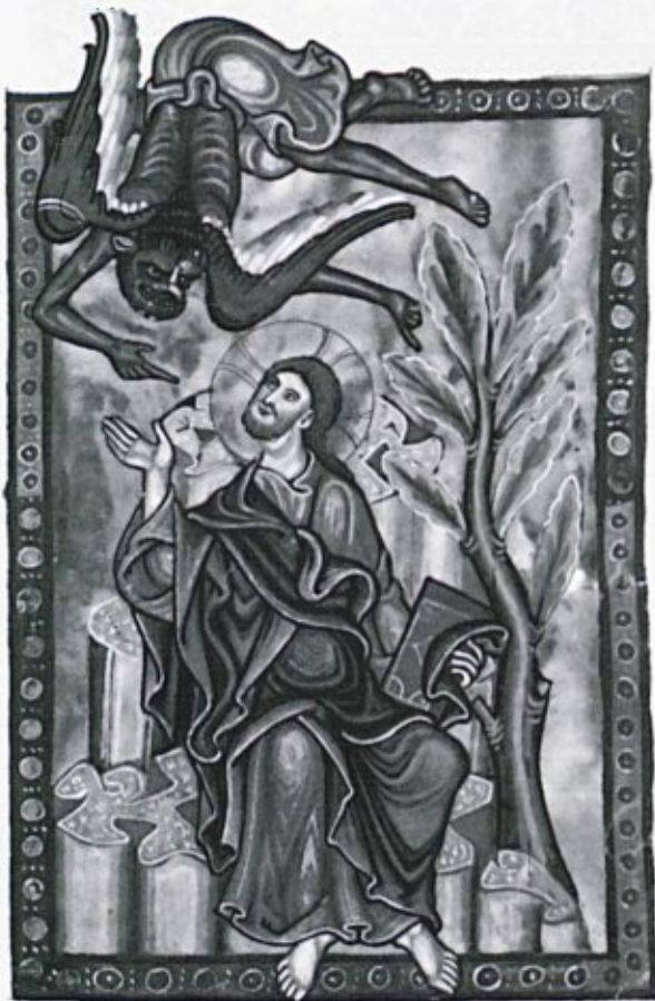
Upodobitev hudiča z brado in krili iz okrog 1230 (Bamberg, Staatsbibliothek, Msc. Bibl. 48, fol. 61r; obj. v: Menschen im Schatten der Kathedrale , Darmstadt 1998, str. 221)

obdobjih na določenih območjih prava obsesija zahodnokrščanskega človeka. 5