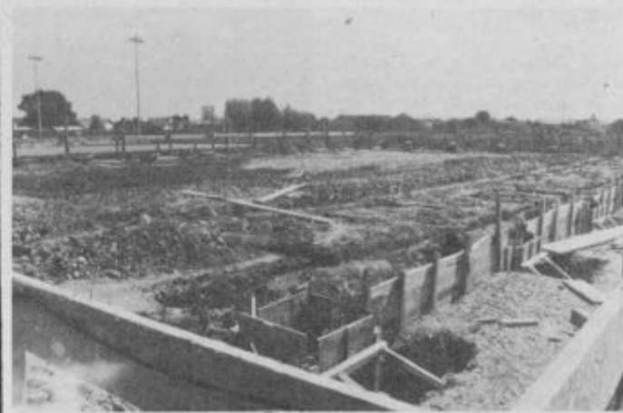
Pogled na začetke gradnje nove telovadnice