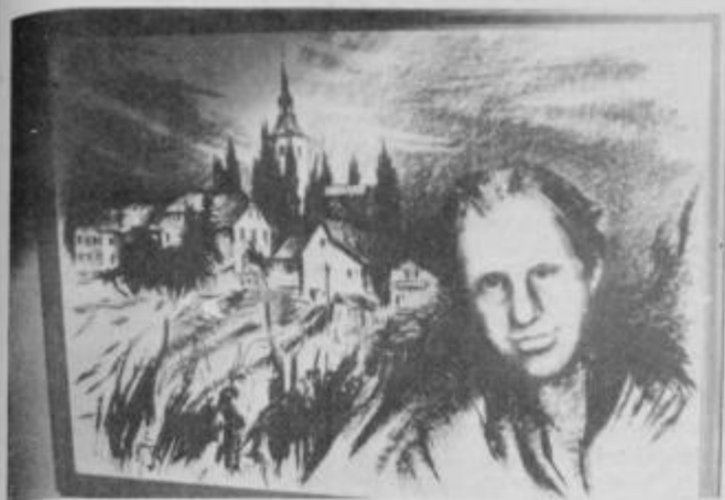
Delo akad. slikarja Bojana Golije, posvečeno Emilu Štumbergerju.