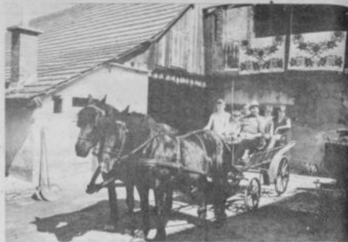
Klepova kočija z družinskimi člani