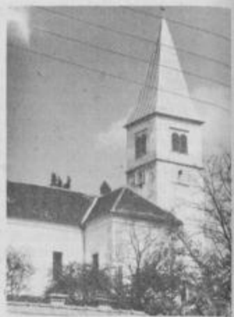
Zvonik bo dobil novo »obleko« in okna