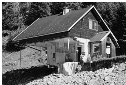
Nekoč bila je hišica v Rastkah v občini Ljuno ob Savinji.