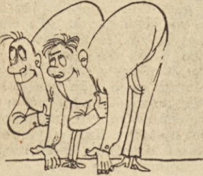
VAJE ZA ZAČETNIKE