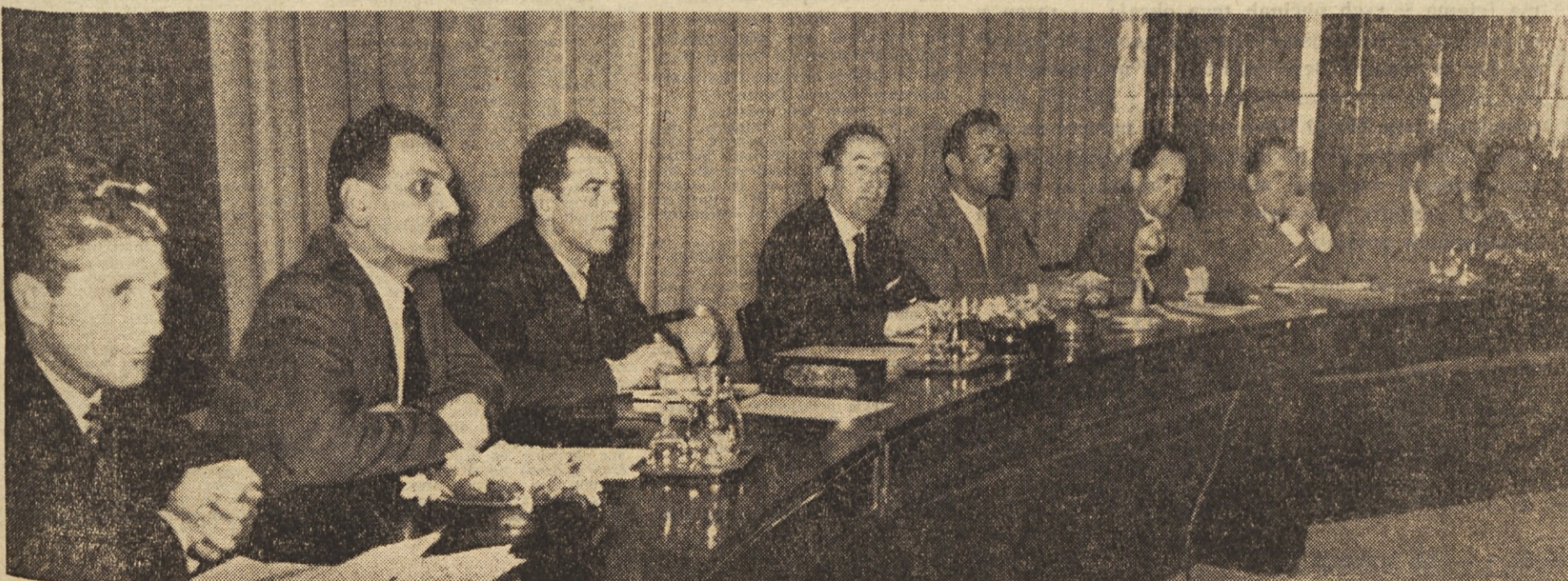
Delovno predsedstvo V. občnega zbora Republiškega sveta sindikatov Slovenije