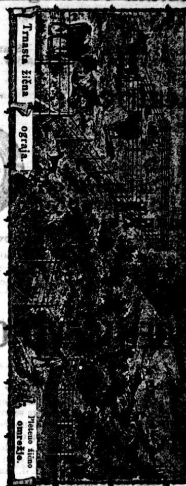
Trnasta žična ograja

106-13 AVGUST-a ŽABKAR-ja priporoča različnih mrežastih ograj za pašnike, vrtove, okna, vrata i t. d. kakor tudi vsa druga kjučavninarska dela. — Niške tovarniške cene. — Točna in solidna postrežba.