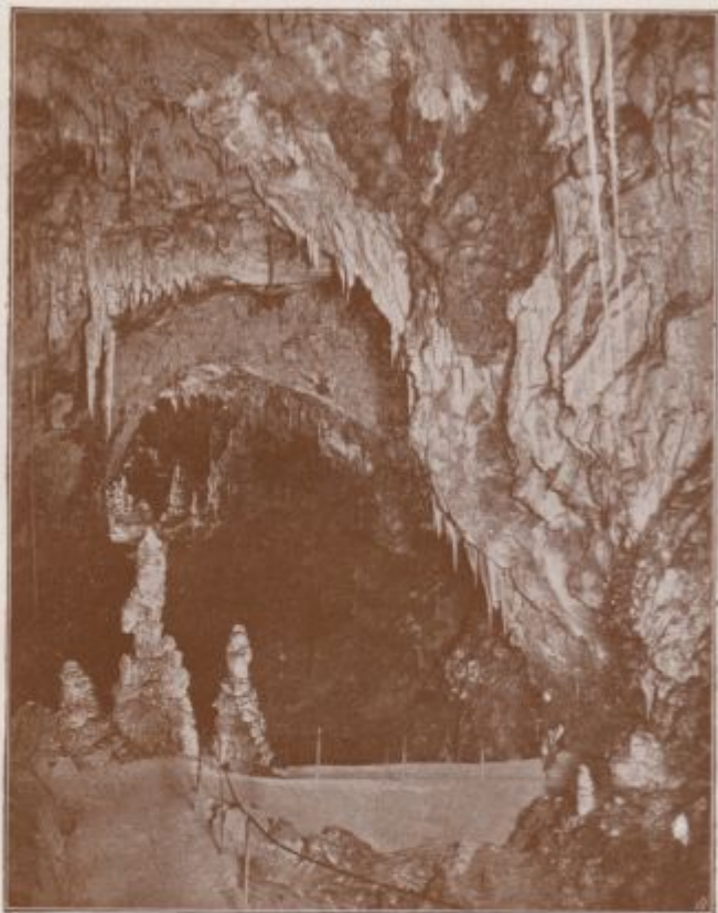
Postojnska jama: Pod Kalvarijo.

na levo od Kalvarije, z imenom Nova jama. Jamo nameravajo v kratkem umetno otvoriti ter jo električno razsvetliti.