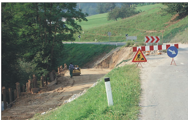
Začela se je sanacija dela ceste Videm - Leskovec v Sovičah