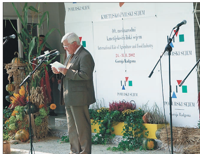
40., jubilejni kmetijsko-živilski sejem je odprl predsednik države Milan Kučan