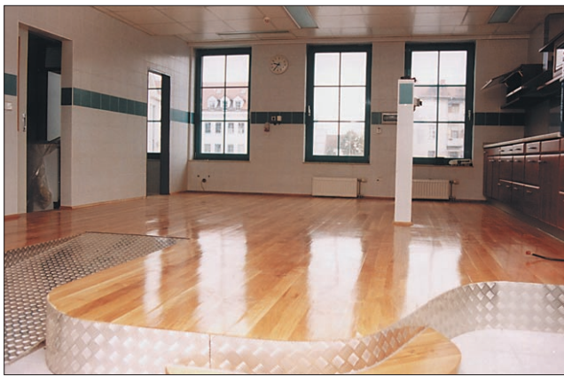
Sodobno opremljena kuhinja čaka na začetek obratovanja