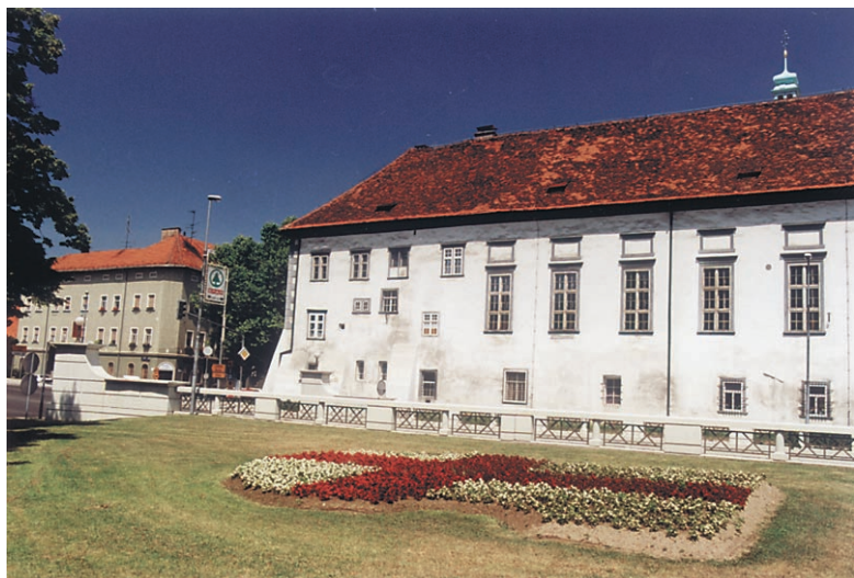
Turistično društvo Ptuj bo tudi letos podelilo priznanja za urejeno okolje.

Odgovore pričakujemo v uredništvu Tednika, Raičeva ulica 6, do 6. septembra.