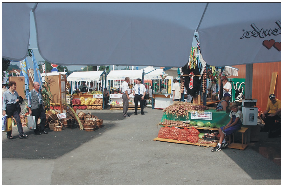
Ob vhodu na sejmišče je postavljena kmečka tržnica iz občine Markovci

"Zdaj ni več dvoma, da razumevanje kmetijstva kot državne