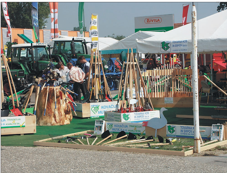
Prvi sejamski dan je bil v Gornji Radgoni živahen, potencialni kupci pa so si z zanimanjem ogledovali razstavljenno blago.

PTUJ / SMRT 20-LETNEGA DEJANA KRAJNCA VZNEMIRJA JAVNOST