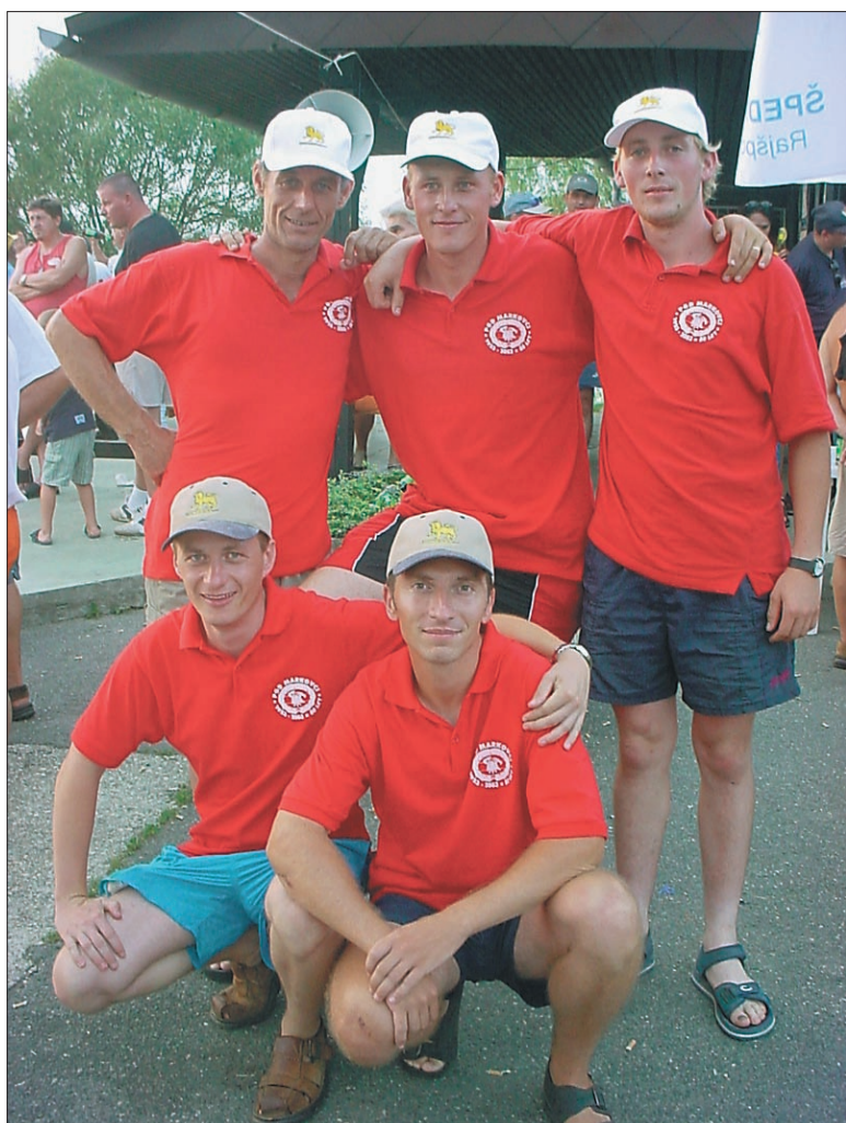
(PS) Markovsko barno

Njeno visoko gladino pa so vseeno z zanimanjem opazovali ljudje z mostu čez jezero in kanal in na mostu pri Borlu, saj je Drava poplavlila grmičevje, ki se je to poletje bohotilo v njeni strugi.