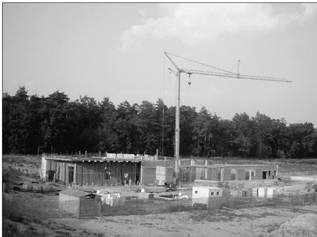
V Novem Jorku so že začeli graditi

jih je temu podjetju izdala naša občina, so podpisana le za destilacijo rožmarina. Če pa bi se želeli ukvarjati še s kakšno dejavnostjo, si morajo pridobiti nova soglasja in ustrezno zavarovati kakršnokoli drugačno proizvodnjo, ki ne sme biti škodljiva okolju. Vem, da se naši občani marsičesa bojijo, a so vse informacije, ki se širijo, neresnične. Obrat, ki se gradi v jami, ima dovoljenje samo za destilacijo rožmarina, iz katerega bodo pridobivali rožmarinovo eterično olje, ki se kot antioksidant uporablja za konzerviranje mesnih izdelkov."