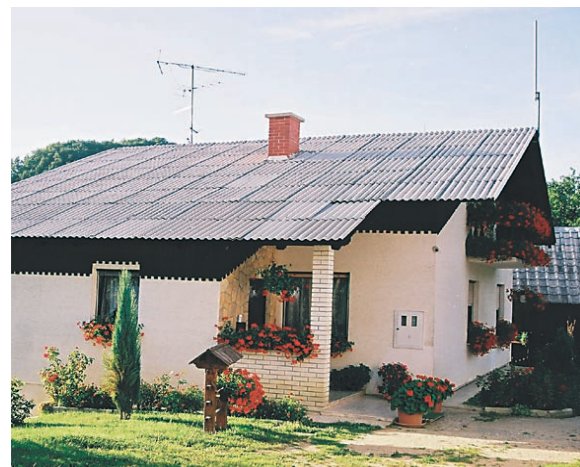
Priznanje za ohranjanje arhitekturne dediščine je prejela družina Mlakar iz Spodnjega Leskovca 8