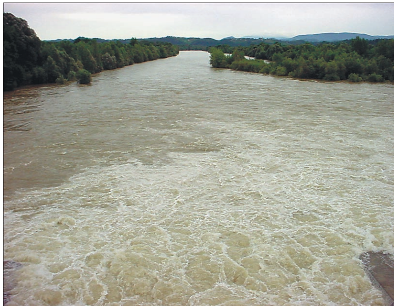
Drava je avgusta letos na srečo le grozila, poplavljala pa ni.

raj ni mogoče in čisto mogoče je, da se bo tam kdaj zgodila kakšna nepotrebna nesreča. Da bi se izognili tovrstnim poplavam, bi moralo cestno podjetje namreč urediti odvodnjavanje in cesto nagniti na drugo stran, tja, kamor bi se odvečne vode potem lahko stekale v stran od naselja. Kljub nekajkratnim opozorilom in pozivom, poklicani še vedno niso nič naredili v tej smeri.