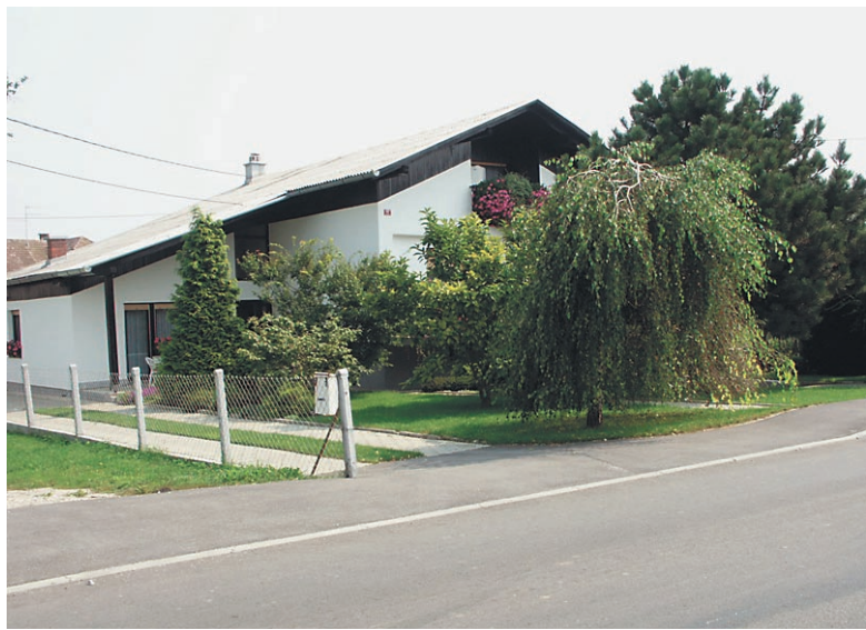
Vsa v zelenju in cvetju je hiša Milene in Vlada Štopferja iz Pobrežja 32 a

gih objektov na območju celotne občine Videm. Letos je komisija ocenila 35 domačij in gospodarskih objektov, priznanja lastnikom najbolje ocenjenih pa so podelili na 7. kmečkem praz-