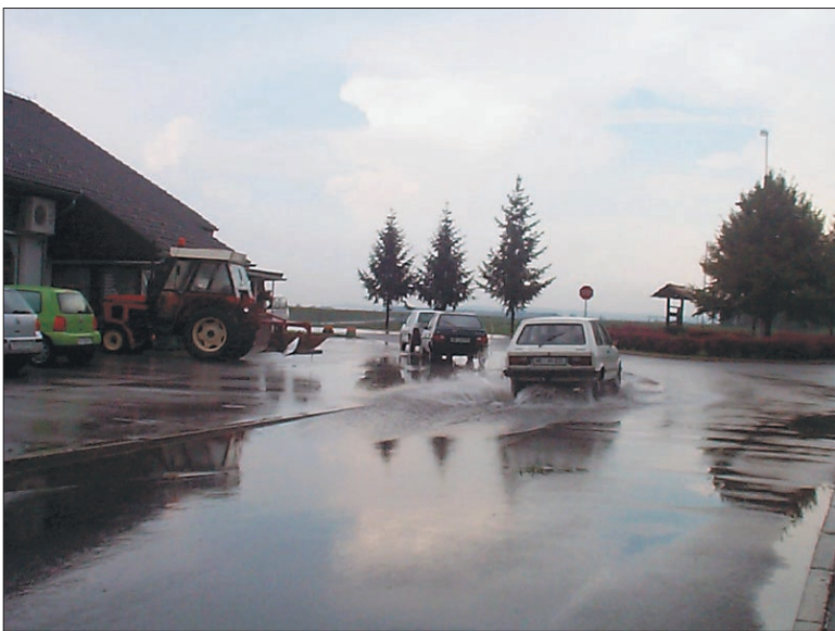
Pri Špicu v Markovcih so takšni prizori prav pogosti.

Nas je obilno deževje nekajkrat do dobra prestrašilo, večje škode pa na srečo do sredine prejšnjega tedna, ko smo urejali ta naš Markovski list, nismo utrpeli. Da pa so z vodo križi in težave vedo tisti, ki jim že nekoliko večja nevihta zagrozi »z vodo do praga in čez«. V Markovcih, na križišču pri Špicu se tako vedno, ko se razbesni nevihtni oblaki in v kratkem času pade večja količina dežja, cestišče znajde pod vodo, do trgovine sko-