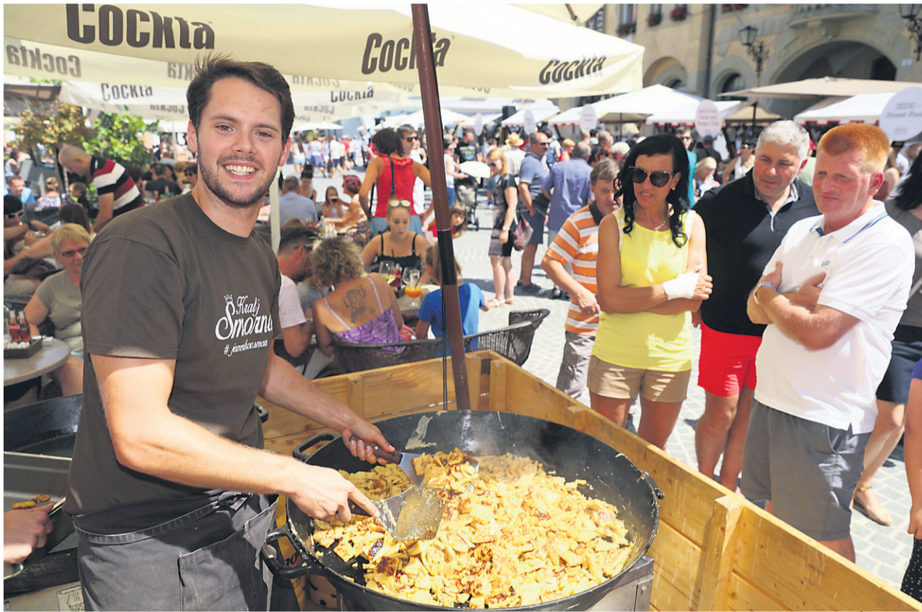
Pri Jezerškovi so pekli šmorn in ga prelili s tremi različnimi preliv; še posebej je teknil z jabolčno čežano.