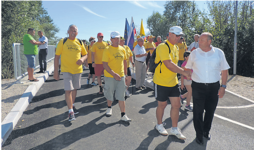
Tako so po mostu, ki tudi po obnovi ostaja enosmeren, v spremstvu župana prvi zakorakali pohodniki.

Obnova mostu s preplastitvijo cestišča, obnovo ograje in pločnikom, instalacijami ter javno razsvetljavo je ocenjena na okoli 80.000 evrov in je v celoti krita iz