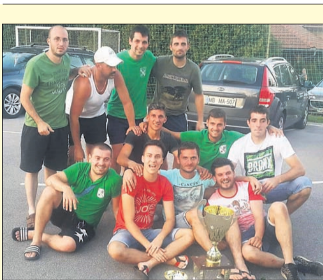
Nogometaši Rogoznice so se veselili zmage na domačem turnirju.

Tako so nogometaši Rogoznice na 3. memorialu Aleša Cajnika po enem letu premora