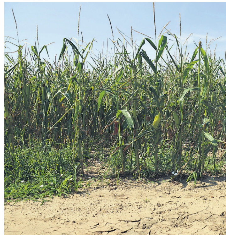
»Letošnje poletje se bo uvrstilo med tri najbolj vroča v zgodovini meritev. navedli na državnem uradu za meteorologijo in hidrologijo pri agenciji za

»Absolutno menimo, da bi bilo dobro obdelati vse njive, ki so na razpolago, in pridelati voluminozno krmo. Več težav bo pri zagotavljanju mase za pitanje prašičev, kajti pridelek koruznega zrnja bo manjši. Zaradi manjših donosov bo koruza držala