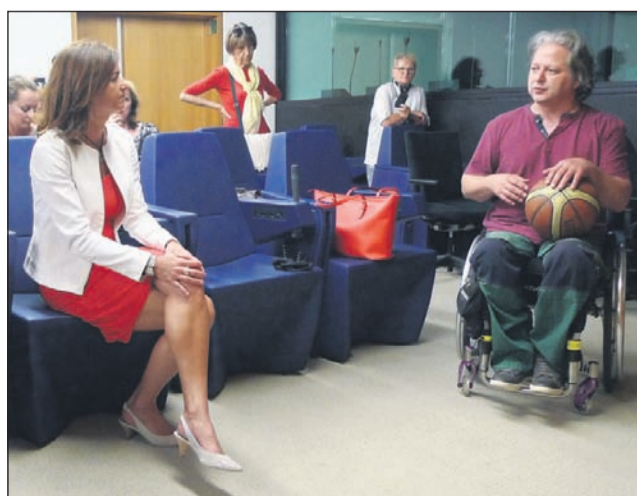
Predstavitve košarke na vozičkih