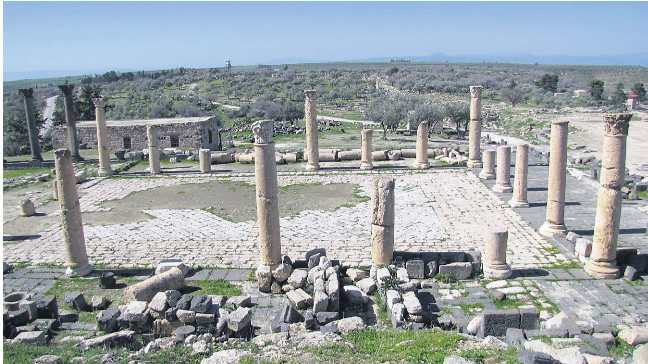
Ruševine in glavna promenada v ozadju, Umm Qais

Pred mano je bil še en lep dan in odločil sem se za izlet v UmmQais, še enega izmed mestec Decapolisa, ki leži praktično na tromeji med Jordanijo, Izraelom in Sirijo. Ker je kraj kar daleč od Ammana, sem si hotel nočitev urediti v Irbidu, največjem mestu na severu Jordanije.