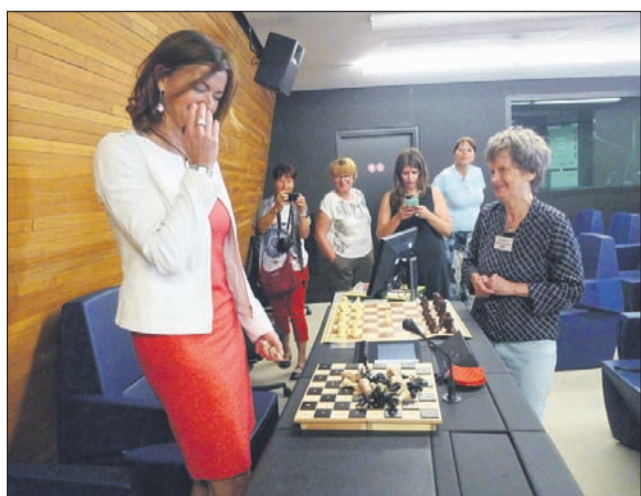
»Kakšne so že osnovne razlike pri šahu za slepe?«