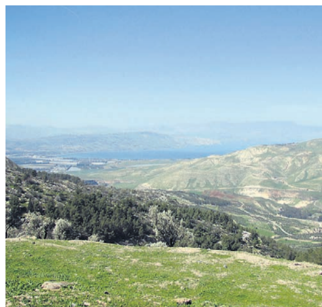
Galilejsko jezero in na desni Golanska planota, danes pod nadzorom Izraela

Umetniške duše bodo našle navdih in ustvarjale svojo umetnino. Čas bo predvsem namenjen službenim obveznostim in projektom. Čeprav bo prizvok počitnic močan, bo prav, da si izoblikujete svoje stališča in se potrudite. Označevala vas bo intuitivna energija.