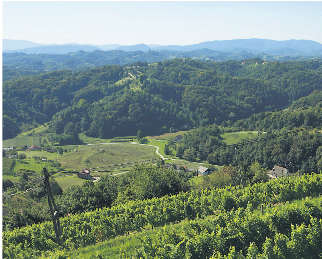
Številne študije, strategije in dokumenti so si enotni: Haloze imajo za razvoj turizma ogromen potencial. Le še