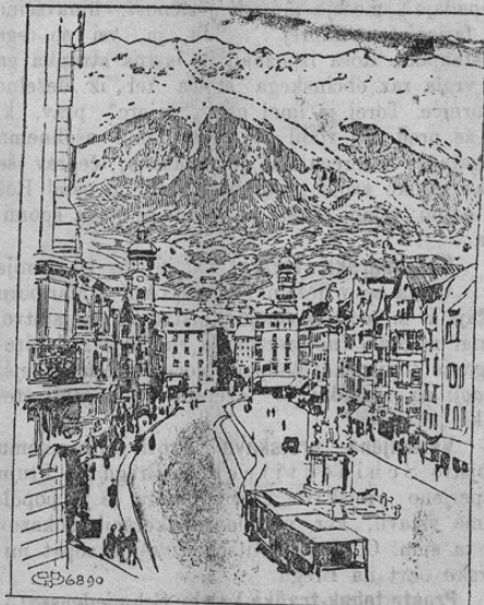
Das neue Innsbrucker Bergbahnprojekt

V glavnem tirolskem mestu Innsbrucku pričeli so ravno prva dela za ureditve nove železnice čez tirolske planine do gore Hafelcar, ki je 2334 m visoka.