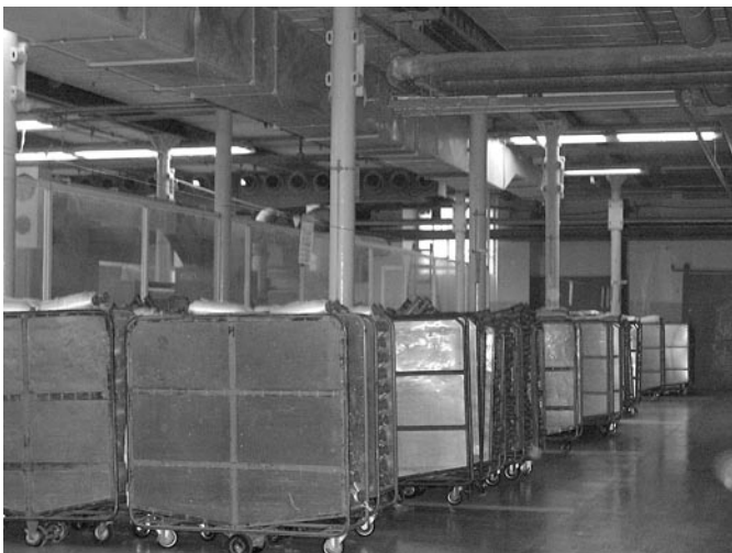
Vozički za prevoz navitkov v predpredilnici.

Pot oz. potek delovnih postopkov sta v proizvodnji točno določena: neočiščen bombaž (ali lan, surovin je namreč več), ki ga pripeljejo s tovornjaki ali po železnici, najprej obdelajo v predpredilnici. V navitkih prepeljejo transportni delavci material v vozičkih v predilnico, kjer se predeluje preja, in na koncu v sukalnico, kjer se oblikuje fina nit.