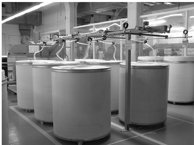
Sistem linij v predpredilnici predstavljajo na tleh zarisane črte, ki zaznamujejo delovna mesta, pozicijo strojev, loncev, vozičkov in transportnih poti. Črte na tleh točno določajo pozicijo delavcev, njihove gibe in poteze.