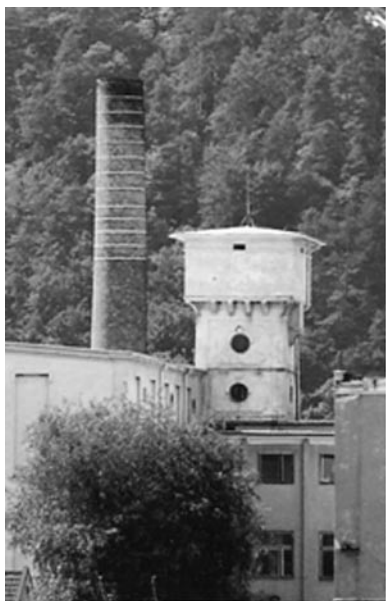
Fotografija dimnika in vodnega stolpa Predilnice Litija.

V postsocialističnem času se je pomen dimnika spremenil. V diskurzu postsocializma in deindustrializacije so industrijska poslopja zamenjala servisna podjetja, moderne poslovne stavbe s pisarnami in trgovski centri. S preoblikovanjem socialnega prostora so tudi delavke in delavce v medijskem diskurzu začeli nadomeščati nove proletarke in proletarci, to so trgovke in trgovci. 3 Vzdrževalec v proizvodnji Predilnice se mi je pritožil nad spreminjanjem okolja in se pri tem skliceval prav na izganjanje kadečih dimnikov: »Potem imamo še bencinske črpalke, pa trgovine. Industrije pa ni. Da bi se še kaj ven kadil iz raufenka, to se pa samo pri nas. Povsod so same trgovine, pa trgovke. Saj je prav, da so trgovke, ampak če drugih firm ne bo, tudi v trgovine ne boš mogel iti.«