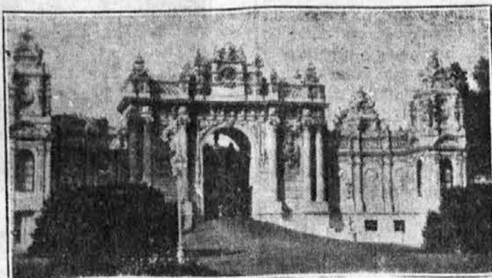
Glavni vhod v sultanovo palačo »Dolma Bakče«