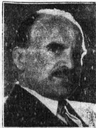
Lige, Rdečega križa itd. v mestni posvetovalnici

ustanove mariborske občine, istega dne bo pa imel tudi ožjo konferenco s predstavniki našega socialnega skrbstva, dobrodelnih organizacij, Protituberkulozne