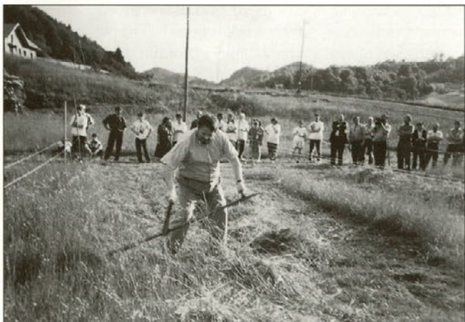
V košnji je sodeloval tudi minister za kmetijstvo, gozdarstvo in prehrano, Ciril Smrkolj.