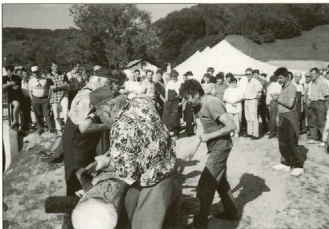
Skupino starejših je ponazorilo tesianje ploha.

Ob zaključku lahko zapišemo le še to, da so se Stoperčani s sklopom letošnjih prireditev ob krajevnem prazniku znova izkazali in tako potrdili svoje organizacijske sposobnosti. Škoda le, da se prireditve niso udeležili v večjem številu predstavniki drugih krajevnih skupnosti v občini — marsikaj bi se lahko naučili.