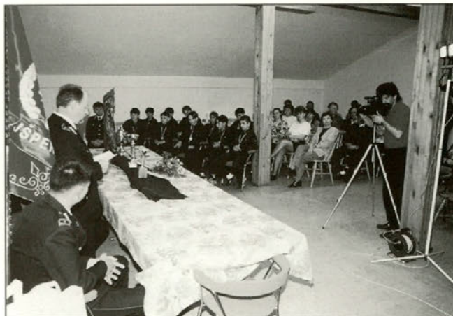
Pozdrav predsednika PGD Majšperk na sprejemu mladih gasilcev.

V soboto, 9. maja je bilo republiško mladinsko tekmovanje za memorial Matevža Haceta v Žižkih pri Črenševcih. Mladinska ekipa je tekmovala v kategoriji mladincev (od 12 do 16 let) MB 300 L — mokra vaja in štafetni tek z ovirami. Tekmovala je zelo dobro, saj je osvojila prvo mesto in s tem lovriko republiškega tekmovanja.