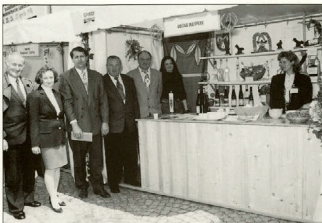
Stojnica Občine Majšperk je bila dobro obložena, to lahko vidite na sliki.