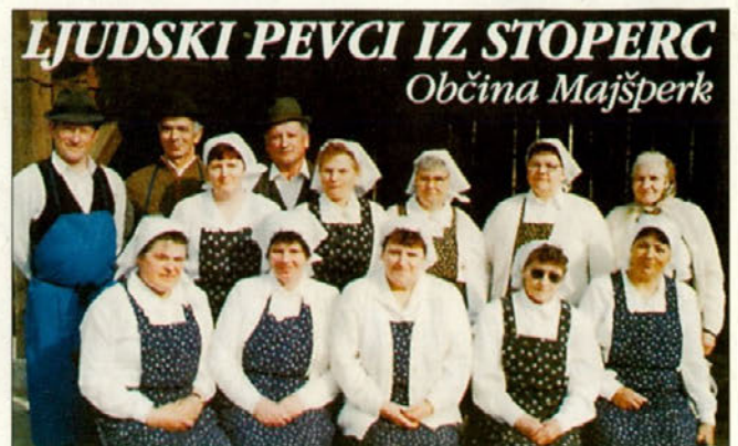
Naslovnica prve kasete.