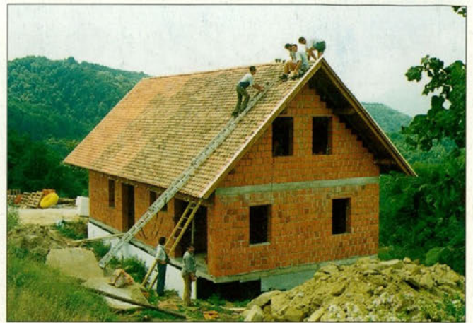
Dela na mežnariji pri cerkvi Sv. Bolfenka.