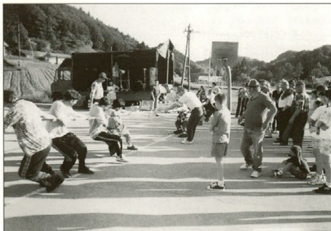
Najmočnejši so svojo moč pomerili pri vlečenju vrvi.