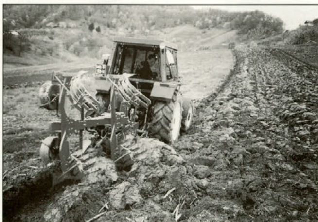
Plugi s trakastimi deskami so posebej primerni za oranje lepljive ilovnate zemlje.

Člani Strojnega krožka Žetalanec so konec meseca aprila in maja organizirali demonstracije sodobne kmetijske mehanizacije, namenjene prav za obdelavo take ilovnate zemlje na zahtevnih terenih. Na organiziranih predstavitvah so sodelovali skoraj vsi pomembnejši izdelovalci kmetijske mehanizacije širšega