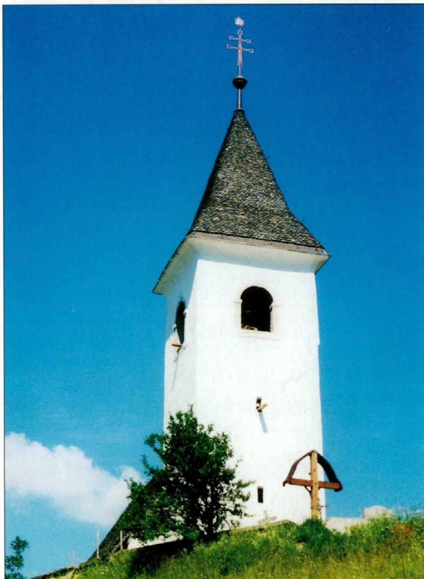
Obnovljena zunanost cerkve Sv. Bolfenka skriva bogato kulturno dediščino preteklosti.

OBČINA MAJŠPERK v sodelovanju s soorganizatorji VLJUDNO VABI NA