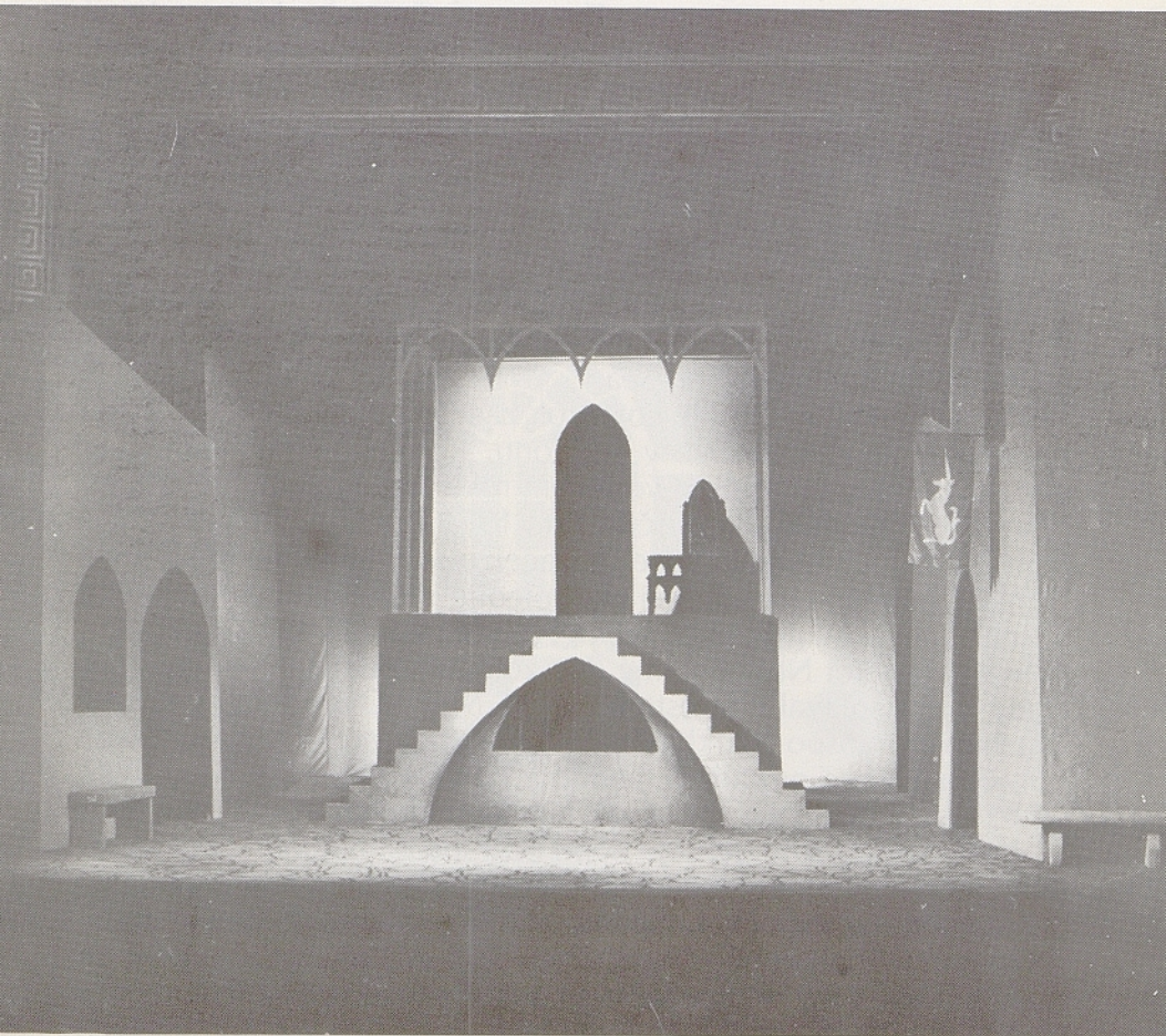
JOŽE BEDIČ, SCENOGRAFIJA ZA PREDSTAVO "SAMOROG" GREGORJA STRNIŠIČE, sezona 1982 / 83