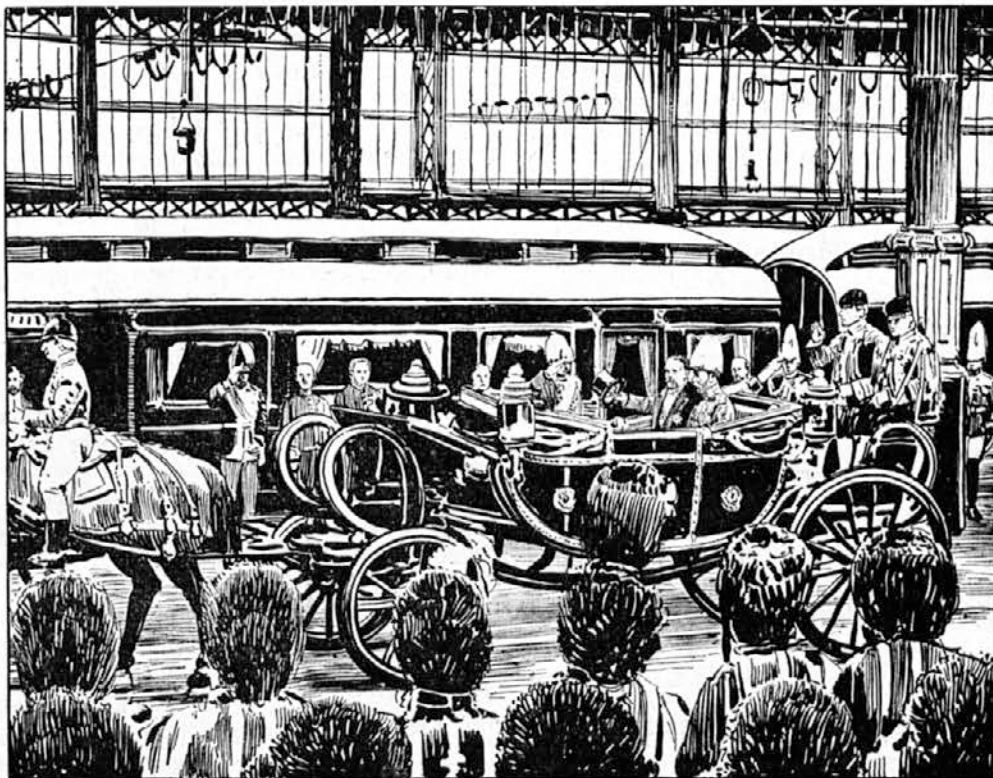
K obisku francoskega predsednika v Londonu. Predsednik Poincaré in kralj Juri med vožnjo od Viktorija-kolodvora h gradu.

Predsednik francoske republike, ki je posetil angleškega kralja Jurija v Londonu, je bil tam prav prijazno sprejet, dokaz, da vlada med obema zveznikoma še vedno prijateljstvo. Angleški vladar se je podal v sijajnem spremstvu, v katerem so bili mini-