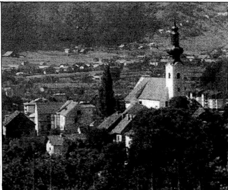
Pogled na stari Šentjur

Občina je bila z zakonom uveljavljena 25. 11. 1980. Njeno središče Šentjur je postalo mesto leta 1990 in ima 60 ulic. Občina šteje 19. 573 prebivalcev, od tega 97 tujih državljanov. Zaposleno je 3. 059 ljudi, registriranih podjetij pa je 231, največje je Alpos (izdeluje vrtno garniture za hotele, letovišča, za gostinske in zasebne vrtove).