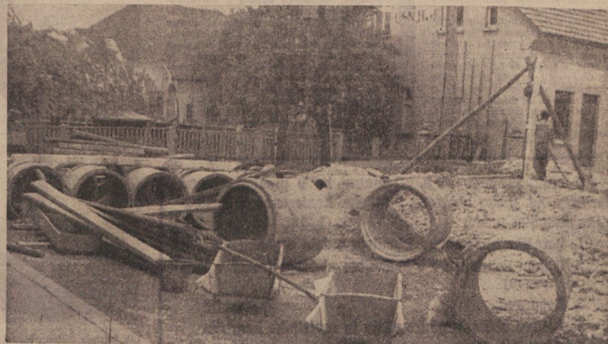
Kanalizacija v Sentvidu, ena izmed pomembnih komunalnih investicij v letošnjem letu

»Most bo v letošnjem letu zgradil Zavod za raziskavo materiala in konstrukcij. Za gradnjo mostu bo prispeval en milijon občinski ljudski odbor, ostala sredstva pa bo dal omenjeni zavod. Dogovor z zavodom je že sklenjen.«