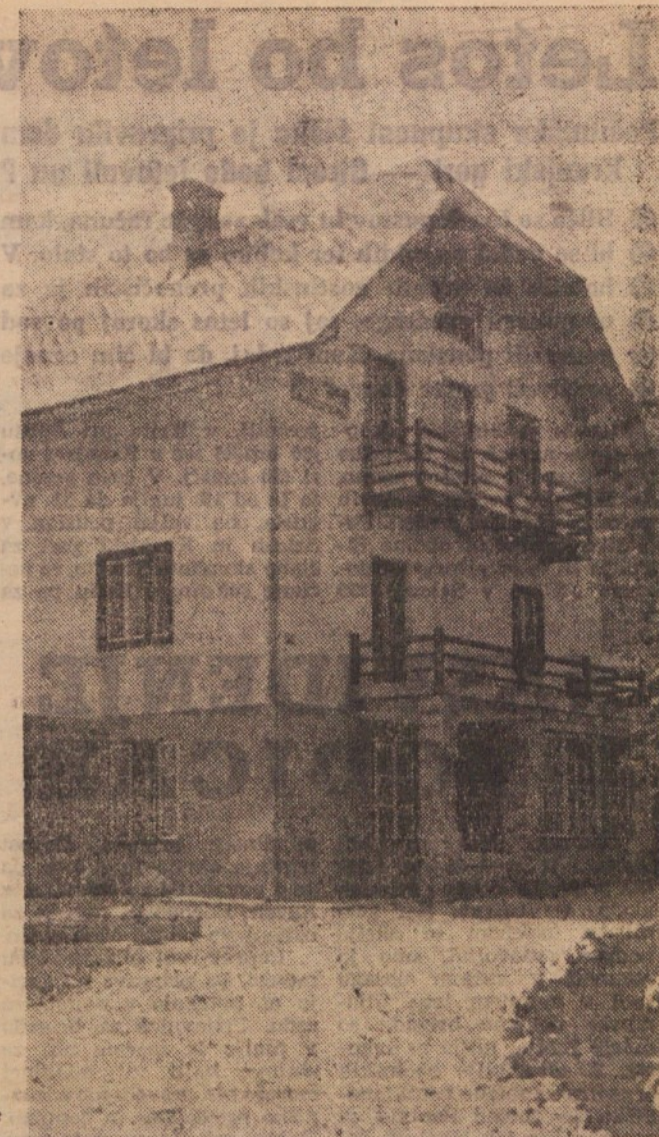
Dom »Počitniške skupnosti Šiška« v Kranjski gori že prikačuje svoje goste