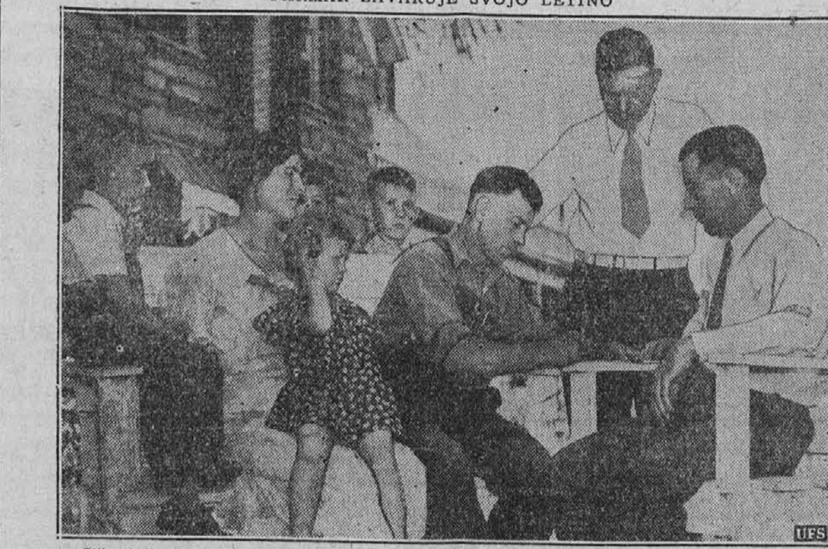
Slika kaže, kako federalna uradnika od Federal Crop Insurance Corp. v Kansasu izstavljaljvata farmerju zavarovalniško polico, katero farmer podpisuje, za zavarovanje letine in pridelkov.