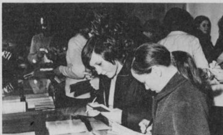
Vitrine odkrivajo preteklost in razjasnjujejo sedanjost.

Večina ptujskih osemletk in srednjih šol je pripravila organizirane