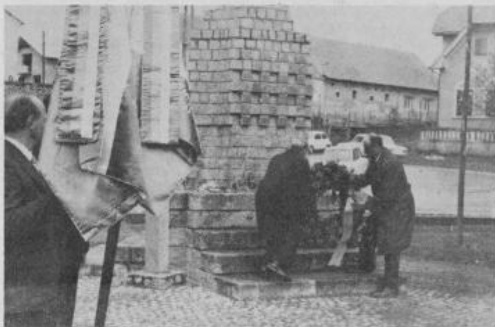
Središčani so vsem, ki so dali svoja življenja za svobodo, takoj po vojni postavili spomenik iz granitnih kock, ob katerem se vsako leto 11. aprila spomnijo svojih žrtev.

Nato se je pričelo zasedanje sekcije za družbeno aktivnost žensk, ki deluje pri občinski konferenci