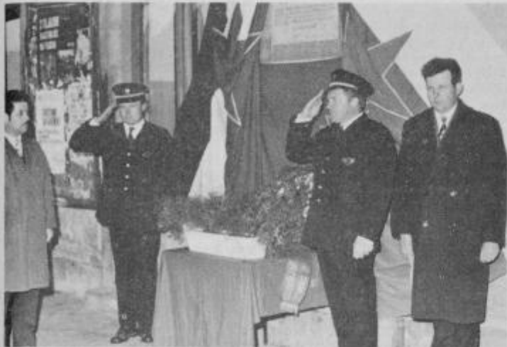
Komemoracija na železniški postaji

tragičen vrh doživela med dvanajst-dnevno stavko v Ljubljani, ko so krogle na Zaloški cesti zaustavile stavkajoče in ubile 13 ljudi. Železničarji so bili organizirani že 1898. leta in ideje partije ter njena borba je bila vedno tudi akcija železničarjev.