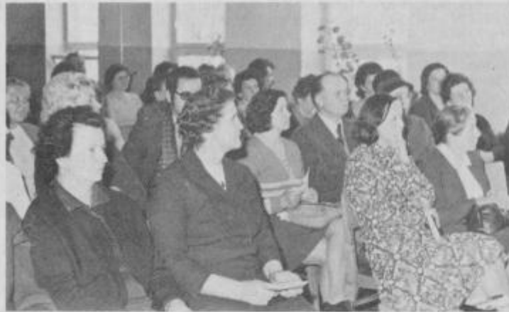
Udeležence konferencie sekcije za družbeno aktivnost žensk

Žene so spregovorile o svojih konkretnih problemih, s katerimi se srečujejo vsak dan. V naših načrtih za napredek kmetijstva moramo računati na trdno kmečko družino kot osnovno proizvodno enoto v zasebnem kmetijstvu. To je h nuja današnjega časa. Ob tem pa lahko postavimo kopico vprašanj in problemov. Kako je z našo kmečko