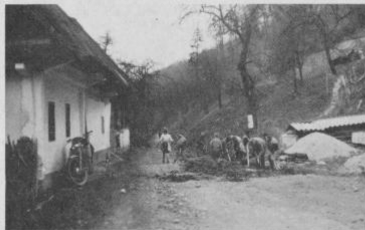
Ena od skupin, ki je prišla za delo na cesti od Jelovca do Starega gradu

V soboto, 7. aprila 1973 se je v SStarem gradu pri Makolah zbralo okoli 50 mladih iz več mladinskih aktivov iz občine, ki so se odločili olepšati kraj. To je torej akcija vseh mladih v občini.