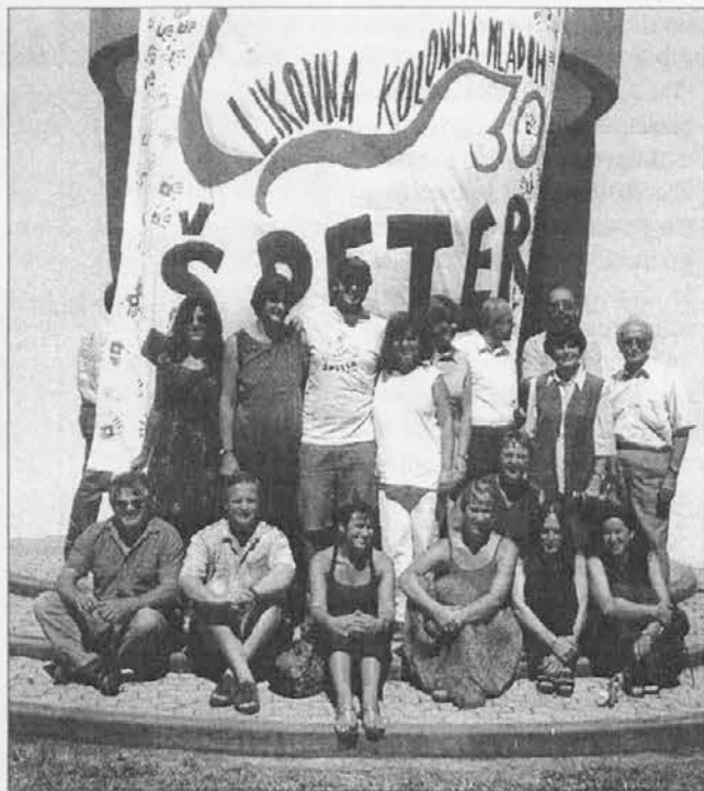
Spominska slika z vzgojitelji in mentorji