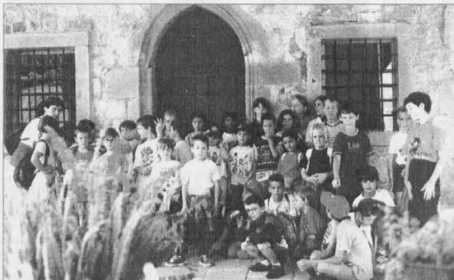
Foto di gruppo dal centro estivo

Ecco, in una foto davanti alla chiesa di S. Bartolomeo, a Vernasso, i bambini che hanno partecipato al centro estivo organizzato lo scorso mese dalla scuola bilingue di S. Pietro al Natissone. È stata una delle tante iniziative, in alcuni casi organizzate anche da amministrazioni comunali, che hanno interessato bambini e ragazzi della Benecia, che hanno tra l'altro avuto modo di scoprire i segreti della propria terra e della propria cultura