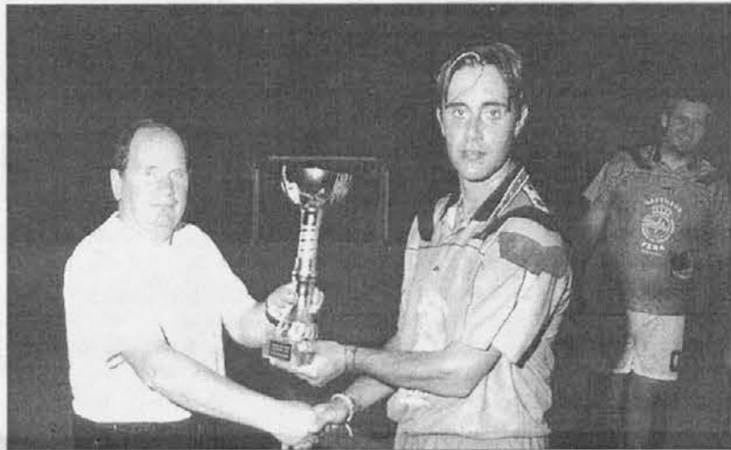
La consegna della coppa alla squadra vincitrice