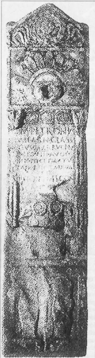
Monumento funebre di centurione romano a Poetovium (I secolo)

Eppure l'esercito romano fu un'espressione molto caratteristica nella storia. Era sorto come milizia in difesa dell'autonomia di un piccolo territorio sul Tevere, ma dal V secolo in poi fu pron-