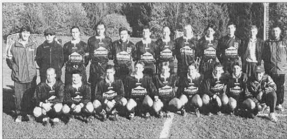
La Valnatisone che ha disputato la stagione 1999/2000