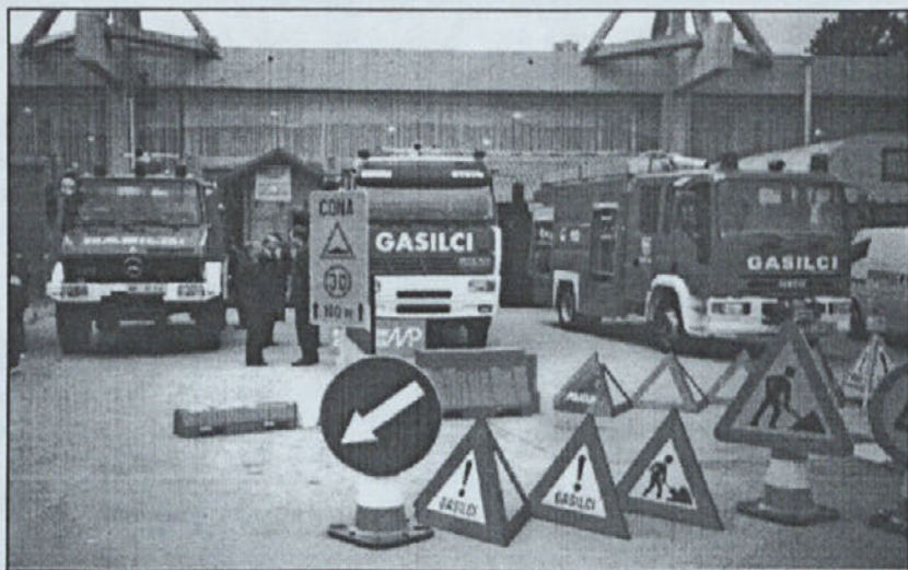
Utrinek iz sejma