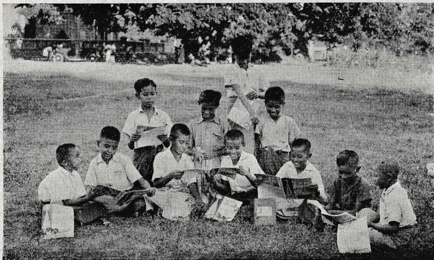
Mandalay v Birmaniji: Sirote iz salezijanskega zavoda pri zabavi na trati.