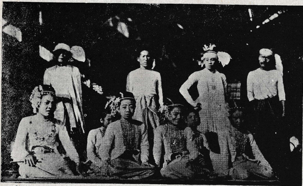
Birmanija: Družina Altajcev z visokih gora v pisani narodni noši.

„Duhovnik ne gre sam v nebesa, pa tudi ne sam v pekel. Če lepo živi, pojde v nebesa z dušami, ki jih bo rešil s svojim lepim zgledom; če slabo živi, če daje pohujšanje, pa pojde v