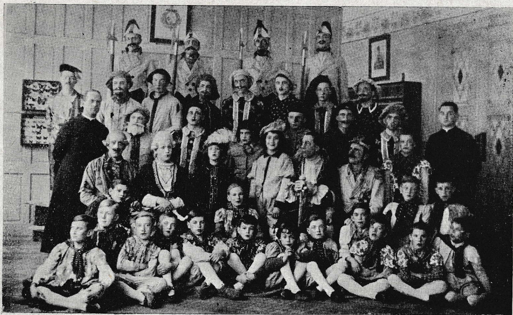
Radna: Skupina igralcev iz lepe spevoigre „Pevčka s planin“, labodjega speva radniške igralske družine.

sama, povedala tele znamenite besede: „Duhovnik si, mašuješ; posihdob boš torej bliže Jezusa Kristusa. Toda vedi, da maševati se pravi trpeti. Tega sicer ne boš takoj opazil, ali sčasoma se boš prepričal, da je imela tvoja mati prav. Prepričana sem, da boš vsak dan molil zame, bodisi zdaj, dokler živim, bodisi po smrti; to mi je dosti. Ti poslej skrbi samo za zveličanje