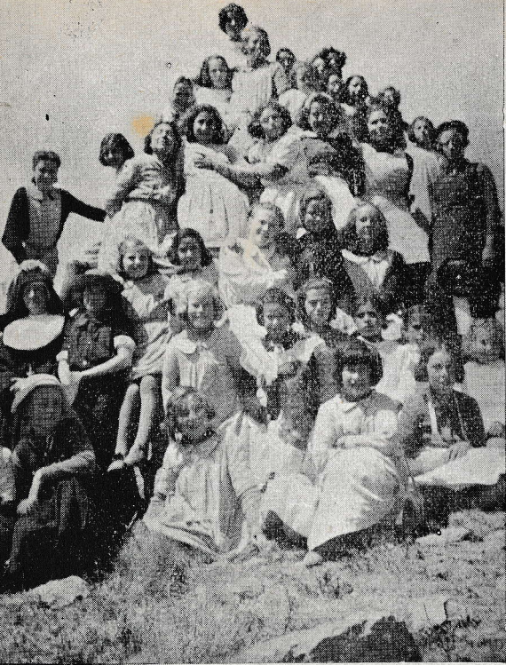
Puerto Deseado (Argentina): Salezijanske gojenke na izletu v gorah.

ložaja — meji namreč na Indijo, Tibet, Kitajsko, Francosko, Indokino, Siam in na Bengalski zaliv — in svojega naravnega bogastva v pridelkih in rudah je politično in gospodarsko izredno važna dežela. In prav zaradi tega je bila najbrž izločena iz skupnosti Indijskega cesarstva in dobila samostojno upravo.