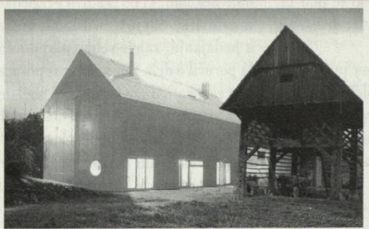
Odnos do preteklosti